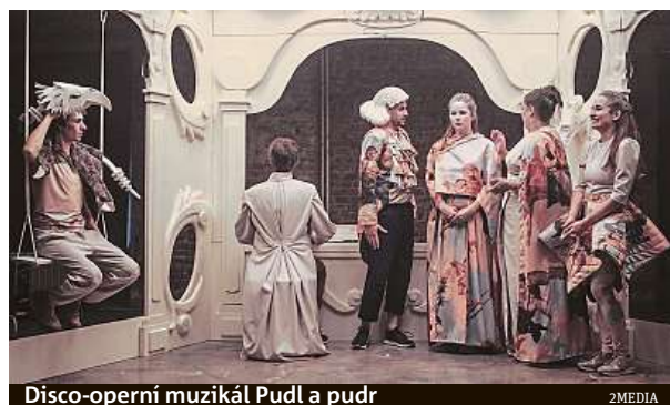
Disco-operní muzikál Pudl a pudr