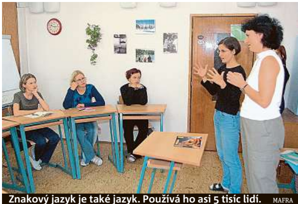
Znakový jazyk je také jazyk. Používá ho asi 5 tisíc lidí. MAFRA

„Češtinu uvádí, a to nepřekvapivě, téměř devět milionů dotazovaných. Jako svůj jediný mateřský jazyk,“ uvádí Jakub Vachuška z oddělení metodiky, analýz a diseminace sčítání. Na druhém místě v Česku figuruje slovenština,