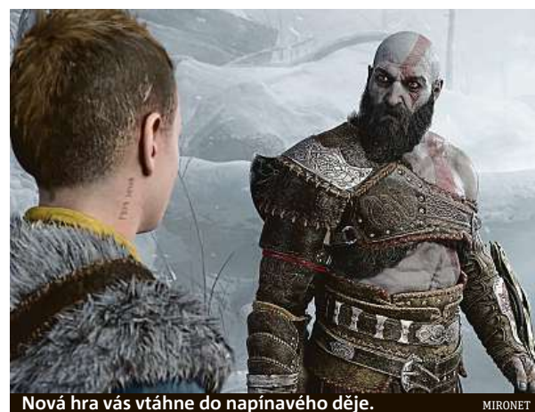
Nová hra vás vtáhne do napínavého děje.

Hru God of War Ragnarök předobjednáte v internetovém obchodě Mironet.cz od 1699 Kč včetně tematického dárku.