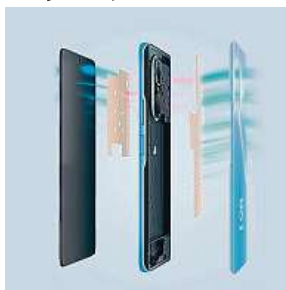
Huawei NOVA 9 SE MIRONET

Bonusem pro některé může jistě být také druhý slot na SIM kartu, který lze případně využít i jako slot na paměťovou kartu. Snadno si