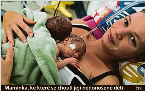
Maminka, ke které se choulí její nedonošené děti.