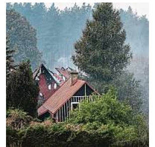
Zkáza v Hřensku. Snímky vlevo a zcela vpravo zachycují požár v obci Mezná. Na snímku uprostřed jsou spálené lesy na dohled Pravčické brány.