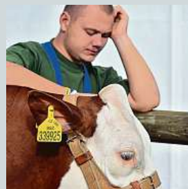
Na výstavě skotu

hlasování členů České filmové a televizní akademie. Jestli se tento film dostane do přímých nominací ve své kategorii, se dozvíme 22. ledna. Samotná ceremonie se uskuteční o měsíc později.