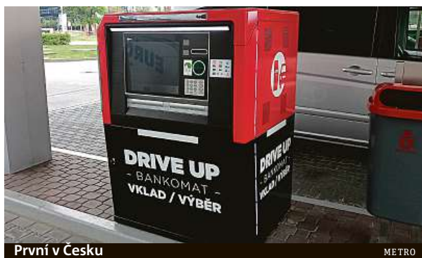
První v Česku