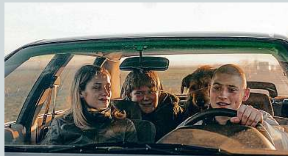
Záběr z filmu Všechno bude

Do konce srpna zemřelo při nehodách způsobených mladými řidiči 47 lidí, mají na svědomí 13 procent všech úmrtí na silnicích. Letos na silnicích zatím zemřelo celkem 349 lidí. Mladí lidé jsou rizikovou skupinou řidičů hlavně kvůli nedostatku zkušenosti a často podceňují dopravní situaci. IDNES.cz