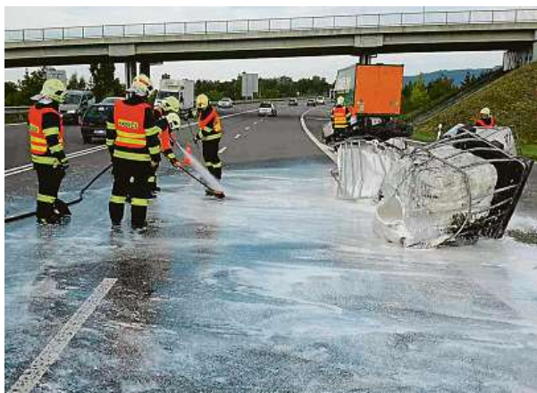
Uniklá látka není nebezpečná.