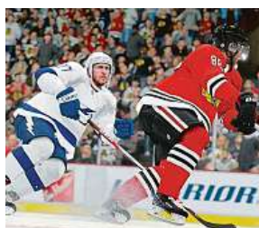
NHL 19 2x MIRONET

V letošním ročníku se vrátíme k samým kořenům, dostaneme totiž možnost začít s kariérou tak, jako v historii začínaly tisíce a tisíce hokejistů po celém světě – na obyčejném venkovském zamrzlém rybníku.