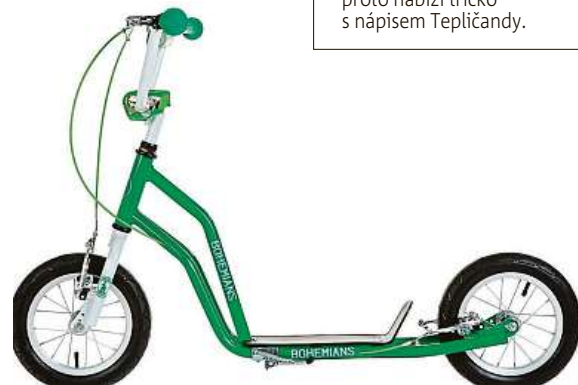
Fanoušci Bohemky se svezou na koloběžce. BOHEMIANS.CZ