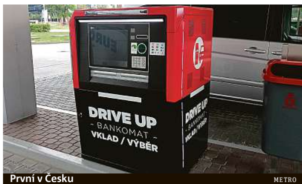
První v Česku