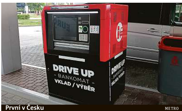
První v Česku