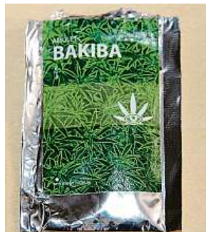
Balíček drogy

Nebezpečná syntetická droga vyvolává poruchy vědomí, křeče, v nejhorším případě smrt.