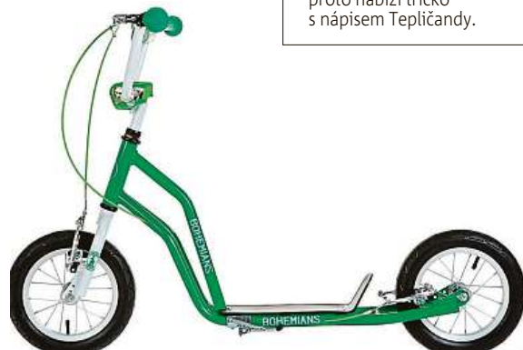
Fanoušci Bohemky se svezou na koloběžce.

Dresy a šály, to je letitá klasika, která se neomrzí. Právě takto vyzbrojení vyrazí fanoušci na stadion povzbudit svůj klub. Dříve byly v kurzu i odznáčky či kloboučky. Na doma pak třeba vlaječky nebo skleničky.