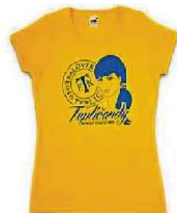
Triko pro ženy FKTEPLICE.CZ

Kluby mají pro své příznivce bohatou nabídku předmětů.