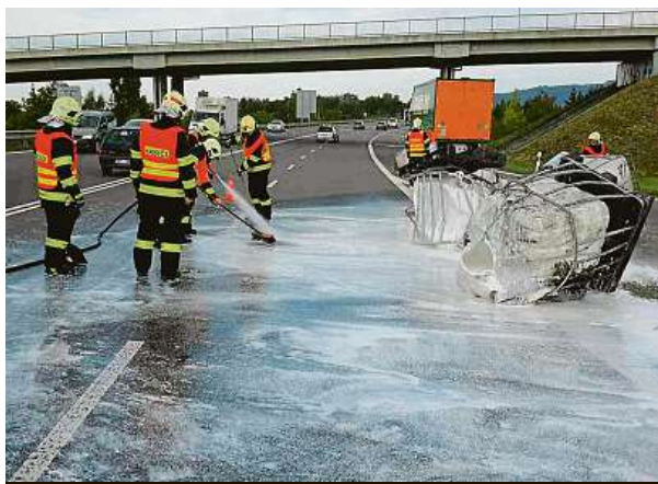
Uniklá látka není nebezpečná.