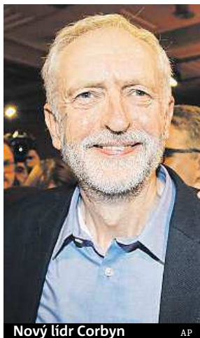
Nový lídr Corbyn

Labouristé si o víkendu do čela strany zvolili nejlevicovějšího, nejvzpurnějšího a nejméně zkušeného vůdce ve své historii, uvedla BBC. Ano, Corbyn je ostrým odpůrcem politiky rozpočtových škrtek, dů-