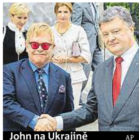
John na Ukrajině

Britský zpěvák Elton John by se rád setkal s ruským prezidentem Putinem a promluvil si s ním o jeho „směšných“ názorech na práva homosexuálů. Zpěvák to podle serveru BBC řekl během návštěvy na Ukrajině. I tu vyzval k větší toleranci vůči sexuálnímu menšinám. Červnový pochod rovnosti v Kyjevě se totiž neobešel bez incidentů.