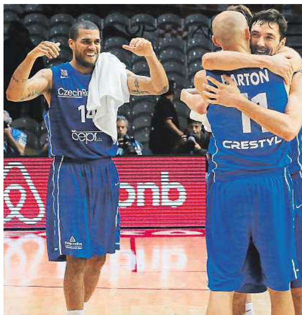
Radost českých basketbalistů z postupu byla obrovská.

„Porazit Chorvatsko a postoupit do čtvrtfinále je pro český basketbal obrovský úspěch. Sám nevím, kdy byl český basketbal takhle daleko. Neví to ani Jirka Welsch. A ten už si toho pamatuje hodně,“ žertoval Ginzburg na adresu pětatřicetiletého českého kapitána.