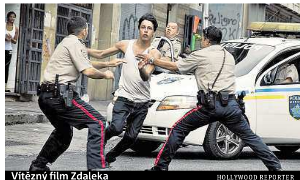
Vítězný film Zdaleka

Stříbrného lva za nejlepší režii získal Argentinec Pablo Trapero s křímí El Clan (Klan). Velkou cenu poroty si