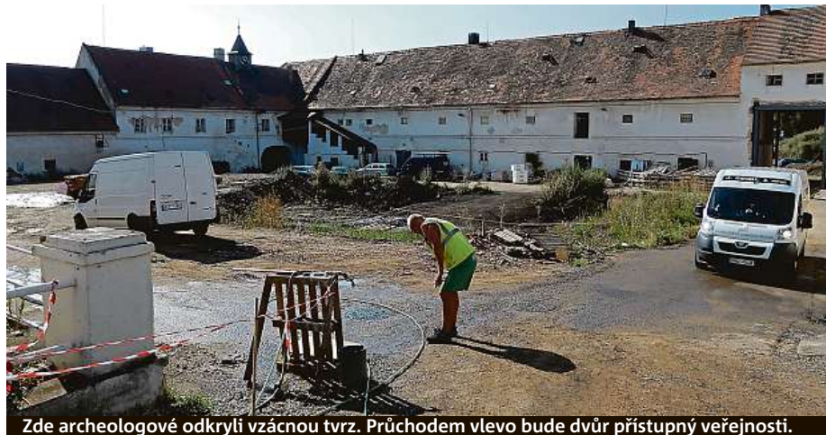
Zde archeologové odkryli vzácnou tvrz. Průchozem vlevo bude dvůr přístupný veřejnosti.