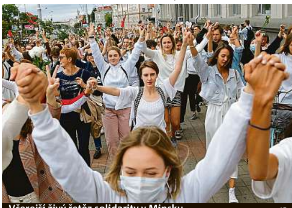
Včerejší živý řetěz solidarity v Minsku

Od včerejšího rána lidé v Minsku vytvářeli živé řetězy solidarity s postiženými policejní brutalitou. Několik nezávislých kanálů zpravodajské služby Telegram ve videích ukazovalo, jak lidé v Minsku, Grodně, Brestu a dalších městech požadovali, aby Lukašenko ukončil násilí a odstoupil. Zároveň vzrostla solidarita s demon-