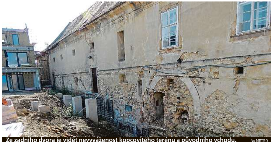
Ze zadního dvora je vidět nevyváženost kopcovitého terénu a původního vchodu.