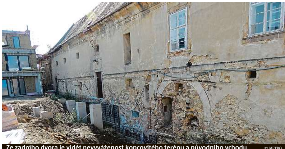
Ze zadního dvora je vidět nevyváženost kopcovitého terénu a původního vchodu.