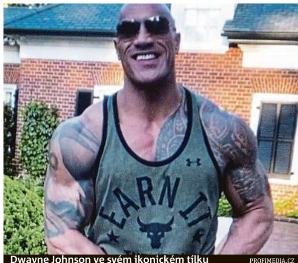
Dwayne Johnson ve svém ikonickém tílku

Svými kolaboracemi jsou proslulí také dva nejznámější světoví výrobci takzvaných plátěnek – firmy Vans a Converse. Typická bývají spojení z nejrůznějšími umělci, jinými značkami či filmovými sériemi. Když se například Converse loni spojil se znovuobjevenou japonskou značkou Comme des Garçons, která na jejich klasickou siluetu přidala srdíčka s očima, šlo o obrovský, nyní již obtížně sehnatelný hit. Totéž platilo o jejich loňské kolekci Golf le Fleur*, kde spojila značka síly s dnes sedmadvacetiletým Tylerem, the Creatorem. Totéž dělá také Vans, jejíž ikonický slip-on model připomíná české jarmilky. A také láká k umístování nejrůznějších kreseb a obrázků. „Popularita této značky stále roste. Vliv na to rozhodně má právě i nespočet kolaborací, kterých se Vans nebojí,“ uvádí teniskový prodejní web footshop.cz. Značka se v minulosti spojila třeba s kapelou Led Zepelin, zpěvákem Davidem Bowiem či kouzelnickým světem Harryho Pottera.