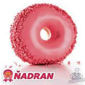
Růžová kobliha má evokovat zdravá Ďadrana.

Za civilizační choroby i vážné nemoci může také vybíjení bakterií ve střevní mikrobiotice. Té se říká mikrobiom a jeho kondice i skladba bakterií je o dost nižší než u předků. „Mohou za to i porody císařským řezem, a hlavně nadužívání antibiotik, jež vyvraždí nejen některé nepřátelské, ale i ty přátelské,“ varuje molekulární biolog RNDr. Petr Ryšávek. Byť o tom, jak který kmen bakterií ve střevě funguje, věda moc neví, jejich vliv na nemoc, ale i na obezitu a psychiku prokázány je. „Nevhodně zvoleným probiotikem můžete potíže zhoršit, proto se jako první na světě zaměřujeme na probiotika, jež se vyrábějí pro pacienta na míru na základě analýzy mikrobiomu,“ dodává. Více čtěte v novém vydání týdeníku Téma.