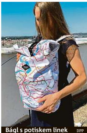
Bágl s potiskem linek DPP

Existují také další kolaborace, které však nejsou vždy pochopitelné takzvané na první dobrou. Svě o tom vědí zaměstnanci pražské pekárny Donuter, jejichž produkty si mohou zákazníci objednat až domů. Nedávno zde totiž začali prodávat koblihu z kynutého těsta, s jahodovou polevou a posypem s jahodovou