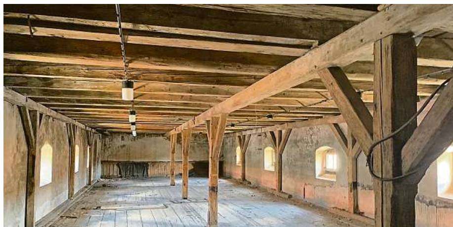
Interiéry budou podpiřat nové i zrestaurované trámy. V restauraci budou kamenné klenby.