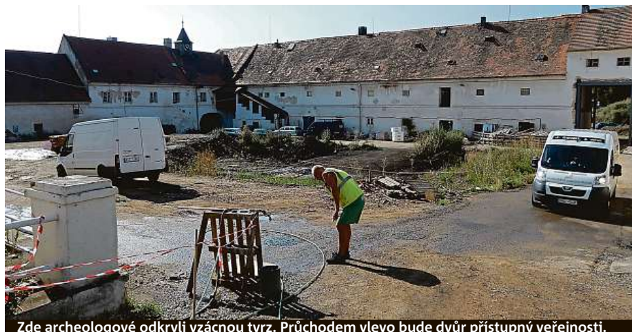
Zde archeologové odkryli vzácnou tvrz. Průchozem vlevo bude dvůr přístupný veřejnosti.