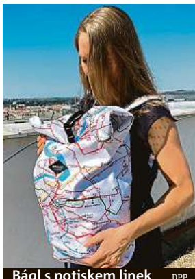
Bágl s potiskem linek DPP

Spolupráce mezi více značkami táhnou. Vědí to nejen nejznámější světoví výrobci, ale i ti tuzemští.