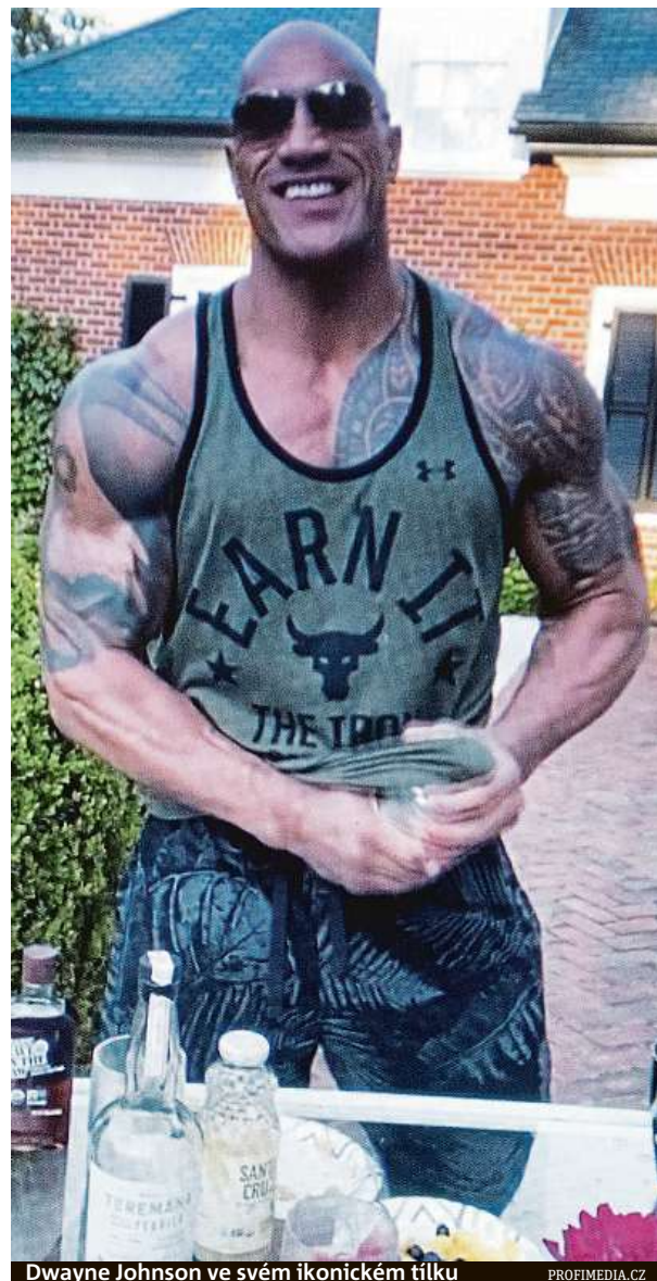
Dwayne Johnson ve svém ikonickém tílku