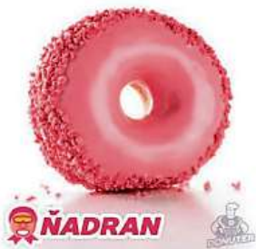
Růžová kobliha má evokovat zdravá Ďadrána.

• Rozvedená a konečně usměvavá Lenka (49). S mužem to bylo peklo, teď si chci začít užít! Odstartujme rovnou v posteli! Vytoč 909 80 50 40 nebo piš SMS na 909 15 45 s kódem 27NXH a tvůj text!