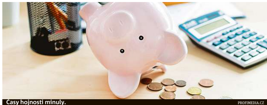
Časy hojnosti minuly.