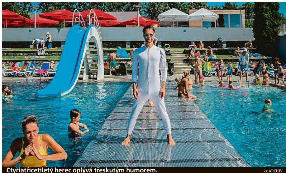
Čtyřiatřicetiletý herec oplývá třeskutým humorem.