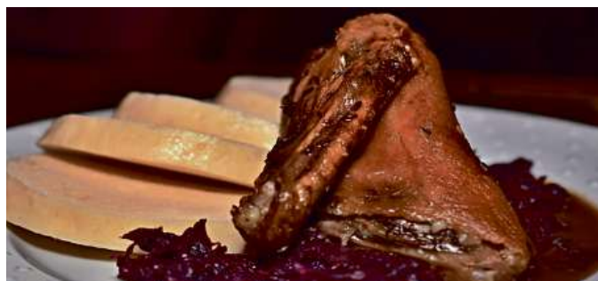
Čtvrťka pečené kačeny se zelím 160 Kč / za 2 porce

V eFiShopu nabízíme také teplá jídla určená k okamžité spotřebě rozvážená v menu boxech, delikatesy a základní potraviny.