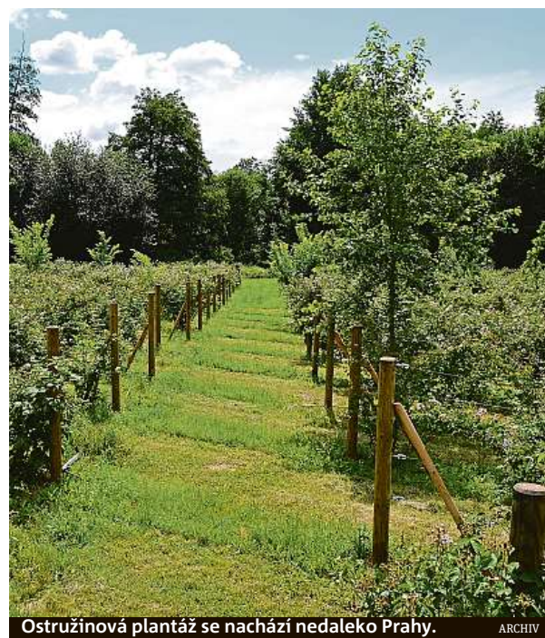
Ostružinová plantáž se nachází nedaleko Prahy.