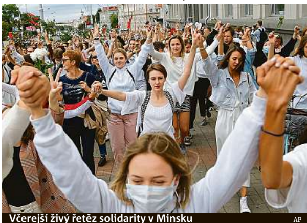
Včerejší živý řetěz solidarity v Minsku

Od včerejšího rána lidé v Minsku vytvářeli živé řetězy solidarity s postiženými policejní brutalitou. Několik nezávislých kanálů zpravodajské služby Telegram ve videích ukazovalo, jak lidé v Minsku, Grodně, Brestu a dalších městech požadovali, aby Lukašenko ukončil násilí a odstoupil. Zároveň vzrostla solidarita s demon-