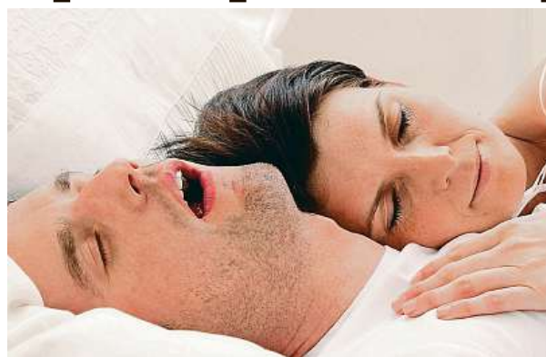
Ze se nevyspíte, je ten nejmenší problém.

Samotné chrápání vzniká při dýchání vibracemi měkkých tkání hltanu. Během spánku se snižuje napětí svalů, které tvoří svalovou trubici, kterou dýcháme. Menší měrou se na chrápání může podílet i nos, respektive jeho vnitřek při větším vybočení nosní přepážky nebo při chro-