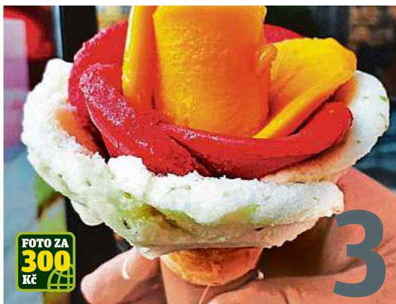
FOTO ZA 300 Kč