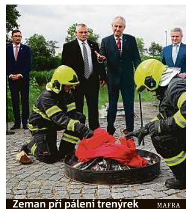
Zeman při pálení trenýrek

Skupina Ztohoven v roce 2015 v převlečení za kominíky vyšplhala na střechu paláce Pražského hradu a vyměnila prezidentskou standartu za červené trenky. Aktivisté ji zabavili a hodili ze střechy. Později skupina oznámila, že vlajku rozstříhala a rozdala lidem. Svou akci chtěla protestovat proti chování Zemana jako prezidenta. Červené trenky se poté staly symbolem odporu proti Zemanovi. Soud jim za čin uložil podmínku.