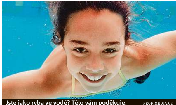
Jste jako ryba ve vodě? Tělo vám poděkuje.