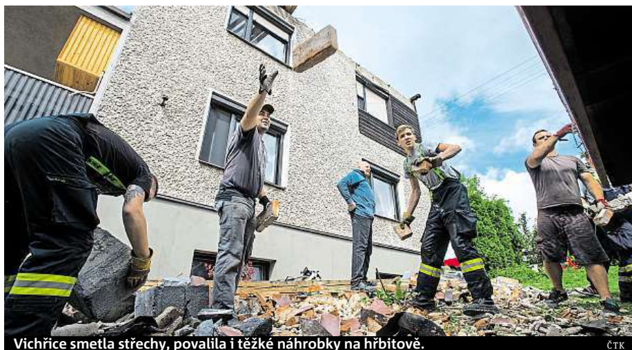
Vichřice smetla střechy, povalila i těžké náhrobky na hřbitově. ČTK

Zhruba 1400 lidí se o víkendu postavilo na start čtvrtého ročníku extrémního závodu ve výběhu skokanského můstku K120 v Harrachově. Letošní účast na Red Bull 400 byla rekordní. V hlavním závodě účastníci běželi 400 metrů v prudkém kopci. Zvládnout tak museli převýšení 139 metrů, v nejprudším místě má kopec 37 stupňů. ČTK