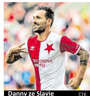
Danny ze Slavie

Nerozhodně se rozešly také týmy Teplic s Jabloncem (1:1). Na gól hostujícího On-