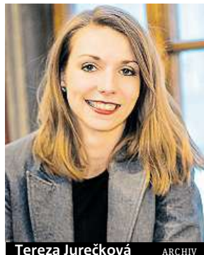
Tereza Jurečková ARCHIV

Průvodci dostanou odměnu přes tři sta korun za každou prohlídku a často jim zákazníci dávají navíc spropitné. Celkem si u nás vydělají docela slušné peníze a zároveň mohou snížit své náklady na život, protože jim nabízíme řadu výhod. Pokud člověk chce, má od nás maximální podporu v tom, aby se z ulice dostal.