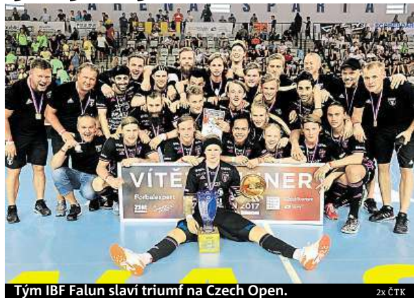
Tým IBF Falun slaví triumf na Czech Open.