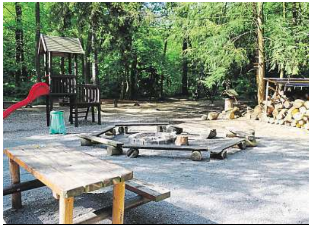
Piknikové místo v Kunratickém lese, u Gizely. LHMP.CZ

Posedět na piknik chodíme nejčastěji s přáteli. V Praze už je takových míst skoro dvě desítky.