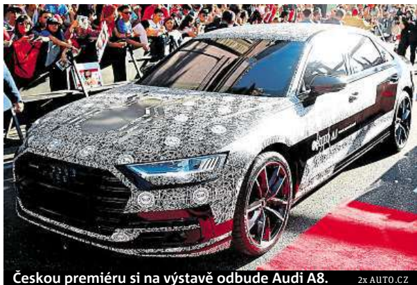
Českou premiéru si na výstavě odbude Audi A8.