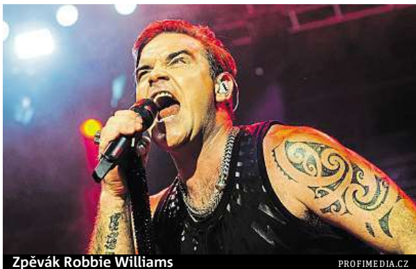
Zpěvák Robbie Williams