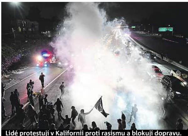
Lidé protestují v Kalifornii proti rasismu a blokují dopravu.