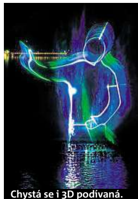
Chystá se i 3D podívaná.

Organizátoři také berou v potaz, že obří výstavy na náplavce některé obyvatele dráždí. Například, když se tu v minulosti konala akce Loď