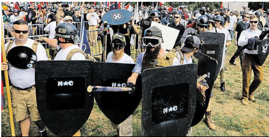
Nacionalističtí demonstranti blokují Lee Park Charlottesville.

Stanovisko šéfa Bílého domu pochválil včera i americký neonacistický web Dai-