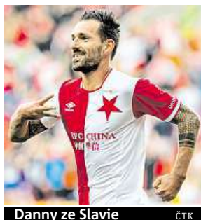
Danny ze Slavie

Nerohodně se rozešly také týmy Teplic s Jabloncem (1:1). Na gól hostujícího On-