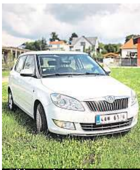
Bílá auta jsou hit. MAFRA

Nejoblíbenější barvou aut mezi tuzemskými motoristy je stále bílá. Za posledních pět let vzrostl podíl prodávaných nových bílých aut o de-