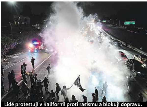
Lidé protestují v Kalifornii proti rasismu a blokují dopravu.