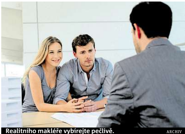
Realitního makléře vyberte pečlivě.

Prodej nemovitosti není nic složitějšího. Proč si však neříct o radu, jakou je například odhad tržní ceny nemovitosti, pokud vám ji někdo nabídne zdarma? Nebo o doporučení, zda a jak nemovitost před prodejem upravit? „Dobrý realitní makléř vám minimálně odhad tržní ceny zdarma rád provede. Dělá to proto, že má šanci vás svou radou a pomocí zaujmout. Avšak pozor, správně je, pokud si nevypracuje vaši přízeň, tedy netlačí na pílu,“ říká Lubomír Mílek, generální ředitel realitní sítě Century 21.