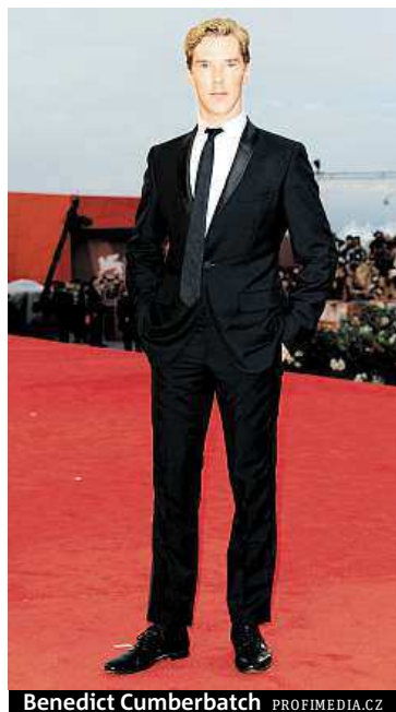
Benedict Cumberbatch