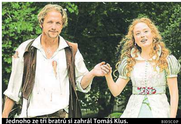
Jednoho ze tří bratrů si zahrál Tomáš Klus.