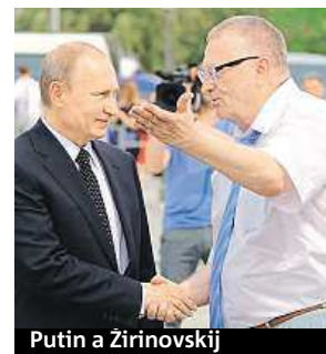
Putin a Žirinovskij

„Pobaltské státy a Polsko jsou určeny k záhubě. Budou vymazány. Nic tam nezůstane. Představitelé těchto trpasličích států by si měli uvědomit, kým jsou,“ prohlásil ruský pravcový populista Vladimir Žirinovskij v rozhovoru pro ruskou zpravodajskou stanici Rossiya 24. Reagoval tak na možný válečný konflikt kvůli Ukrajině. Také řekl, že východoevropské země na rozdíl od Spojených států, které jsou daleko, riskují „naprosté zničení“. „Je to jejich vina, neboť nemůžeme přijmout, aby letadla a střely namířené proti Rusku startovaly z jejich území. Musíme je zničit třicet minut před startem,“ řekl Žirinovskij na adresu východoevropských zemí. ČTK