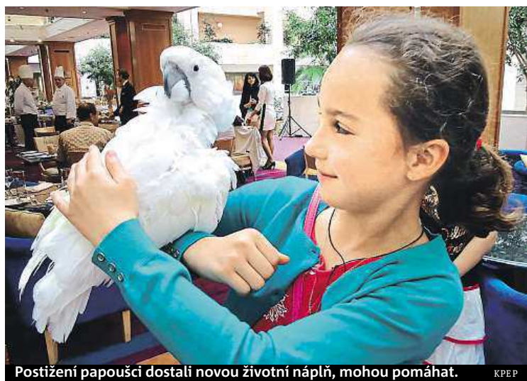
Postižení papoušci dostali novou životní náplň, mohou pomáhat.

I obří barevní papoušci mohou mít psychické problémy, pak sebou škubou, hodně křičí a sebepoškozuji se. Právě tyto papoušci se ale stali součástí speciální ptačí skupiny, která se kamarádí s handicapovanými lidmi z Domova Laguna.