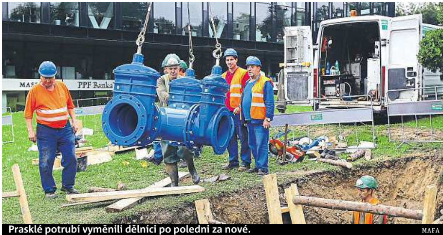
Prasklé potrubí vyměnili dělníci po poledni za nové.

Havárie se stala na rohu ulic Gymnasijní a Evropská. Odstávka se dotkla lidí v Dejvicích, Vokovicích, Liboci a Bubenči. „V místě havárie došlo k prasknutí spoje, v daném místě se spojují dvě potrubí,“ uvedla Dvořáková.