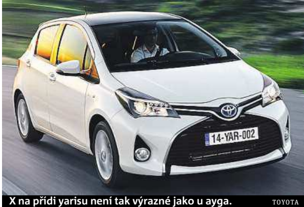
X na přední yarisu není tak výrazné jako u ayga. TOYOTA

Toyota Yaris patří mezi malými hatchbacky už desetiletí k zavedeným pojům. Bývá oceňována zejména pro svou spolehlivost. Proslulost si získala i hybridní verze. Spolu práce benzinového motoru a elektromotoru, pro který si