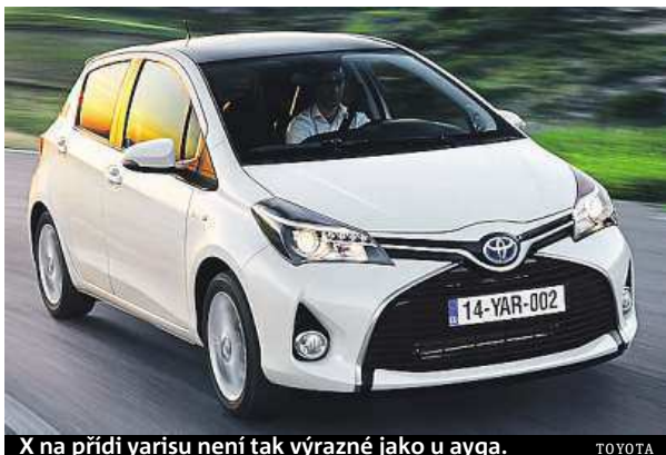
X na přídi yarisu není tak výrazné jako u ayga.

Toyota Yaris patří mezi malé hatchbacky už desetiletí k zavedeným pojům. Bývá oceňována zejména pro svou spolehlivost. Proslulost si získala i hybridní verze. Spolu práce benzinového motoru a elektromotoru, pro který si