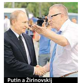
Putin a Žirinovskij

„Pobaltské státy a Polsko jsou určeny k záhubě. Budou vymazány. Nic tam nezůstane. Představitelé těchto trpasličích států by si měli uvědomit, kým jsou,“ prohlásil ruský pravicový populist Vladimír Žirinovskij v rozhovoru pro ruskou zpravodajskou stanici Rossija 24. Reagoval tak na možný válečný konflikt kvůli Ukrajině. Také řekl, že východoevropské země na rozdíl od Spojených států, které jsou daleko, riskují „naprosté zničení“. „Je to jejich vina, neboť nemůžeme přijmout, aby letadla a střely namířené proti Rusku startovaly z jejich území. Musíme je zničit třicet minut před startem,“ řekl Žirinovskij na adresu východoevropských zemí. ČTK