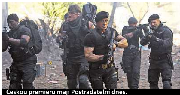
Českou premiéru mají Postradatelní dnes.