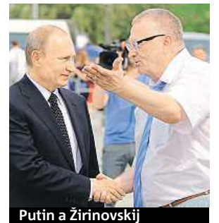
Putin a Žirinovskij

„Pobaltské státy a Polsko jsou určeny k záhubě. Budou vymazány. Nic tam nezůstane. Představitelé těchto trpasličích států by si měli uvědomit, kým jsou,“ prohlásil ruský pravicový populist Vladimír Žirinovskij v rozhovoru pro ruskou zpravodajskou stanici Rossija 24. Reagoval tak na možný válečný konflikt kvůli Ukrajině. Také řekl, že východoevropské země na rozdíl od Spojených států, které jsou daleko, riskují „naprosté zničení“. „Je to jejich vina, neboť nemůžeme přijmout, aby letadla a střely namířené proti Rusku startovaly z jejich území. Musíme je zničit třicet minut před startem,“ řekl Žirinovskij na adresu východoevropských zemí. ČTK