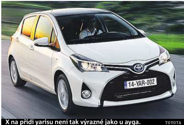
X na přídi yarisu není tak výrazné jako u ayga.

Toyota Yaris patří mezi malé hatchbacky už desetiletí k zavedeným pojům. Bývá oceňována zejména pro svou spolehlivost. Proslulost si získala i hybridní verze. Spolu práce benzinového motoru a elektromotoru, pro který si