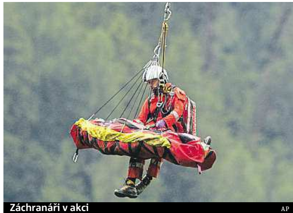
Záchranáři v akci

Pravděpodobnou příčinou neštěstí byl sesuv půdy, který