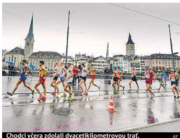
Chodci včera zdolali dvacetikilometrovou trať.