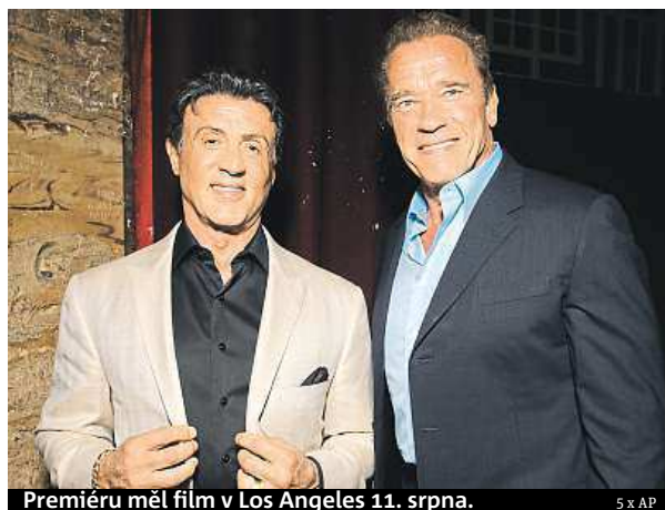
Premiéru měl film v Los Angeles 11. srpna.

„První film byl experiment, který nám vyšel,“ komentoval to Stallone. V plánu je už ale i čtvrté pokračování, jedním z nových jmen má být agent 007 Pierce Brosnan. ČTK