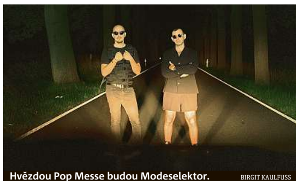
Hvězdou Pop Messe budou Modeselektor.