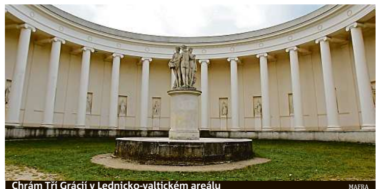
Chrám Tří Grácií v Lednicko-valtickém areálu