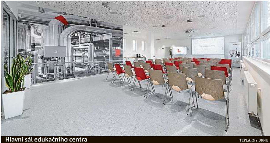
Hlavní sál edukačního centra

„Energetika tvoří jeden z pilířů fungování města. Proto vítám aktivitu městské společnosti rozšiřovat povědomí o této oblasti a motivovat oby-