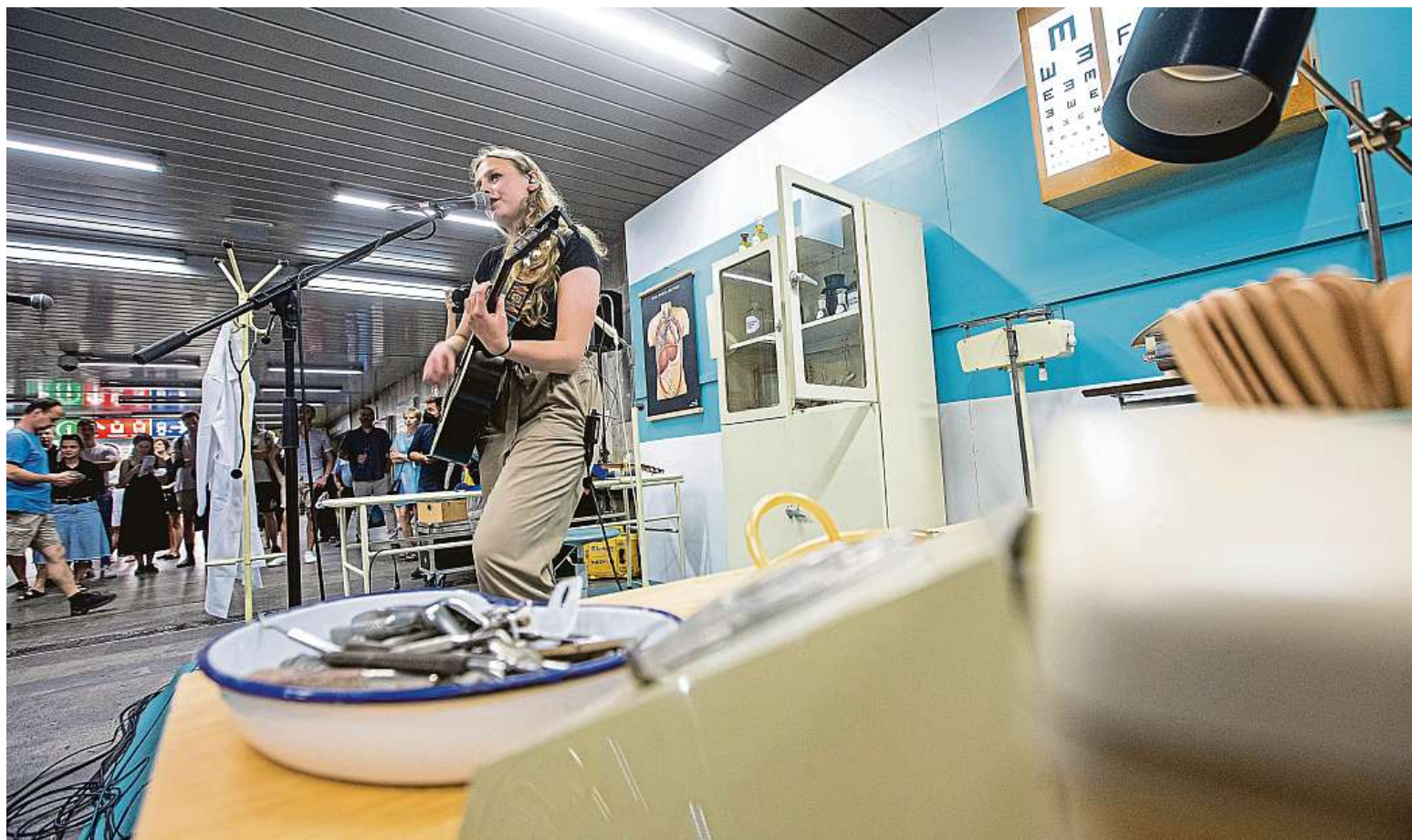
Na Maratonu hudby umělci zahrají také v pouliční ordinaci.