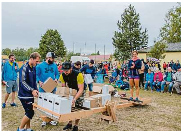
Také na letošní vítěze čeká vyvažování vínem.