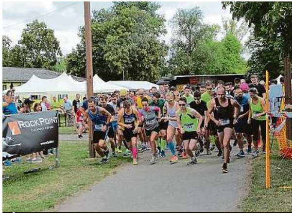
Účast bývá každoročně hojná.

ho stadionu, kde se ve večerních hodinách uskuteční hudební zábava. RADEK BABIČKA