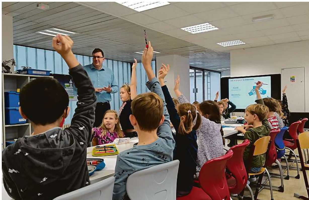
Děti mají o výuku informatiky zájem.