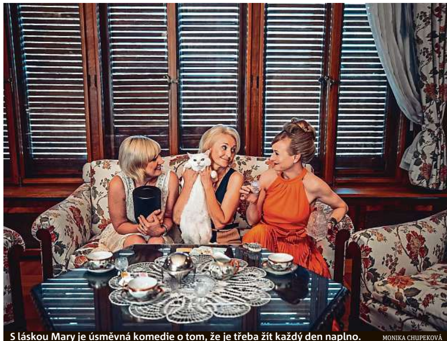
S láskou Mary je úsměvná komedie o tom, že je třeba žít každý den naplno.

Divadlo BuranTeatr letní scénu otevřelo u společenského centra Stadion v Kounicově ulici a prostor zde dostává hlavně nezávislá kultura. Název letní sezony Error 404 #notfound odkazuje k chybové hlášce, kterou znají uživatelé internetu. Chyba uplynulé divadelní sezony spočívala v přerušení spojení mezi živou kulturou a jejími konzumenty. Letní scéna BuranTeatru ji má aspoň částečně kompenzovat divadelníkům i publiku. BuranTeatr pod širým nebem uvede například hořkou grotesku Divadelník, dystopické komediální leprelo Kincugi aneb Věř si, čemu chceš či komponované představení Kabaret U Vrtaného kolena aneb Rozbijte prasátka, přátelé!