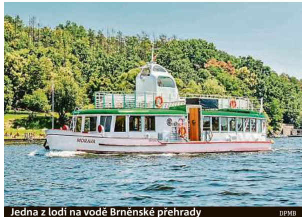
Jedna z lodí na vodě Brněnské přehrady

V okolí Brněnské přehrady je také množství tras pro pěší vycházky, které se liší délkou i náročností. Od loňska je nově upravena trasa zvaná Zouvalka, vedoucí od zastávky lodní dopravy Cyklistická,