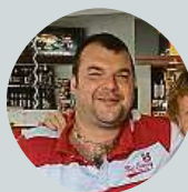
Zdeněk Karásek Karel Gott je můj vzor chování i oblékáním.