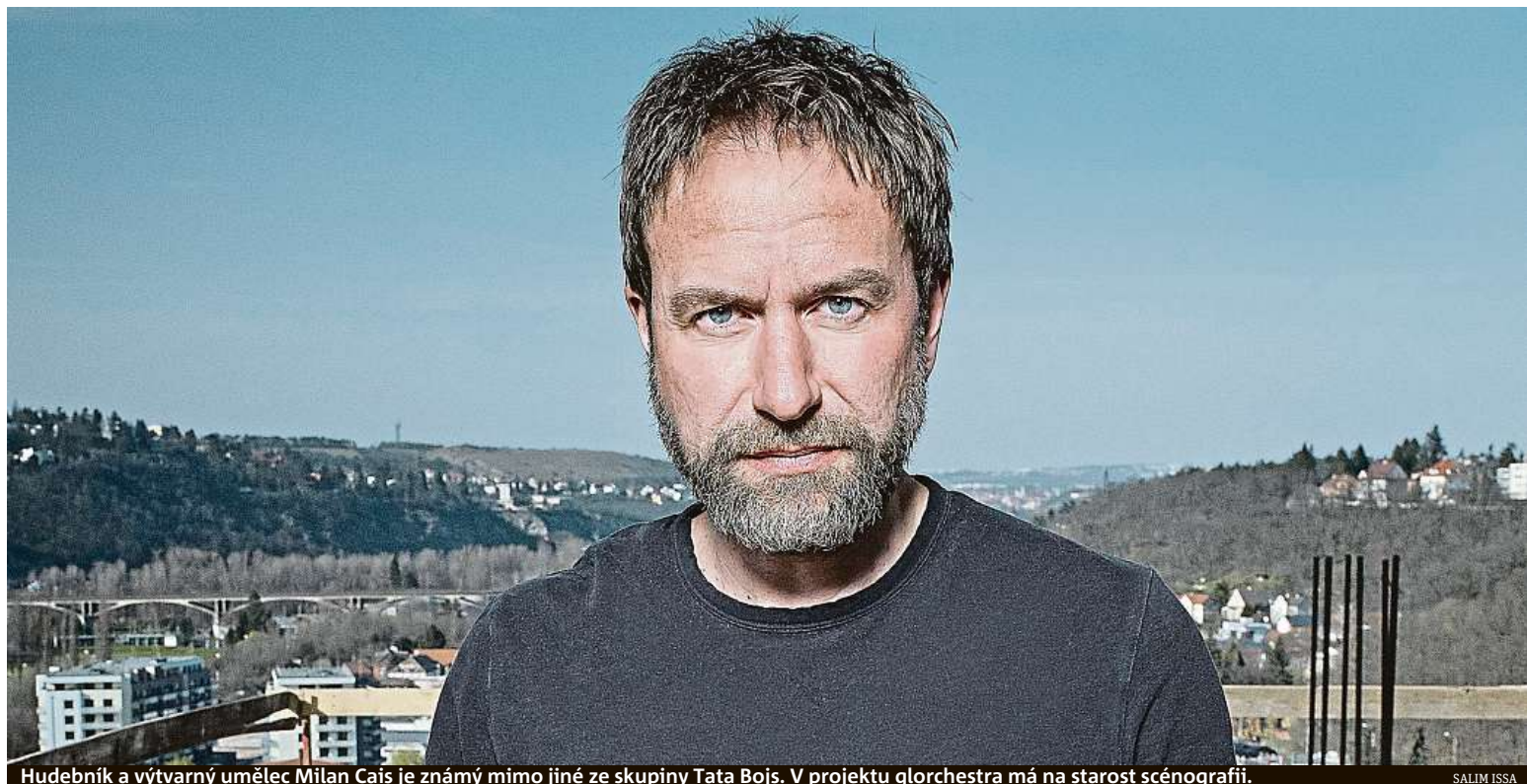
Hudebník a výtvarný umělec Milan Cais je známý mimo jiné ze skupiny Tata Bojs. V projektu glorchestra má na starost scénografii.