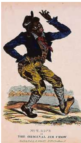
Karikatura Jima Crowa WIKI

Alabama patří mezi americké státy, které jsou nejvíce postižené tornády. V letech 1980 až 1999 byl roční průměrný počet tornád 17,2 a při porovnání s obdobím 2000 až 2019 se jejich počet zdvojnásobil na 34,4. Přesto se řada obyvatel setkává při žádostech o pomoc od Federální agentury pro zvládání krize (FEMA) se zamítavou odpovědí. A velká část z nich je