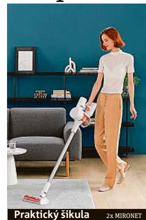
Praktický šikula 2x MIRONET

o objemu 230 ml k úpravě průtoku vody tak, že je vhodná pro použití pro různé typy podlah. Vysavač je vybaven nástěnným nabíjecím držákem, který funguje jako dokovací stanice vysavače. Volitelný rozšiřující slot pro duální nabíjení může nabíjet dvě baterie současně, takže sem tam zapomenout vysavač dobít není problém – jednoduše použijete druhou baterii. Akumulátorový vysavač Xiaomi Mi Vacuum Cleaner G10 pořídíte v internetovém obchodě Mironet za skvělých 5790 korun.