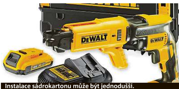
Instalace sádrokartonu může být jednodušší.

Uspadněte si práci při stavbě nebo jen při stavebních úpravách díky akumulátorovému šroubováku DeWalt. Je navržen tak, aby co nejvíce zefektivnil vaši práci při montáži sádrokartonu. Práce v rozích není s tímto šroubovákem žádný problém díky otočnému zásobníku. Bezuhlíkový šroubovák s podavačem vrutů s označením DCF620D2K je ideálním po-