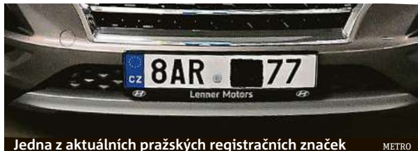
Jedna z aktuálních pražských registračních značek