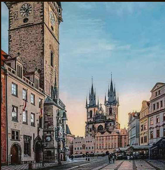
„Magnífica! Fantastica, Jesús!“ Autorem fotky Staromáku s tímto komentářem je chlapík ze španělského San Sebastianu, který se jmenuje Ježíš neboli Jesús. @Jesus_tejon přihodil i tagy #prague #praga #pragueworld #bluehour #portfolioart #best_earthscapes #praguestagram #citylights #mojemetro.