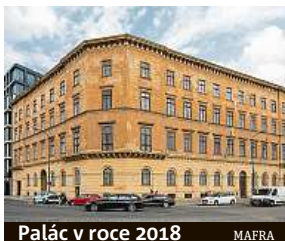
Palác v roce 2018

Chátrající budova nabízí dvě patra výstavních prostor.