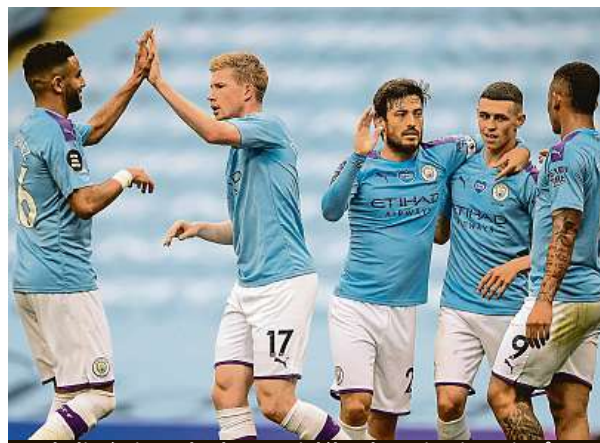
Fotbalisté City se budou moci dál radovat i v Lize mistrů.

„V posledních několika letech hrála finanční fair play významnou roli při ochraně klubů a jejich finanční udržitelnosti. UEFA a Evropská klubová asociace se zavazují do-