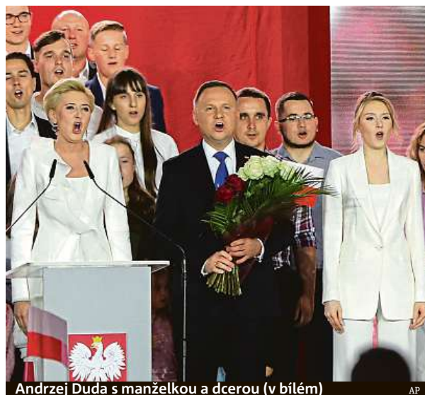
Andrzej Duda s manželkou a dcerou (v bílém)

Zástupci opoziční Občanské platformy uvedli, že shrmaždují informace o problémech při hlasování. „To byly více než organizační zmatky, vypadalo to, jako by se někdo úmyslně snažil snížit počet