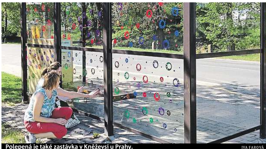
Polepená je také zastávka v Kněževsi u Prahy.

Lidé si problému s prosklenými zastávkami většinou nevěnují. Uhynulá zvířata totiž nejsou tolik vidět. Většinou je hned někdo odstraní. Ve městech zúkladová četa nebo správce zastávky, mimo město liška nebo kočka. „Po-