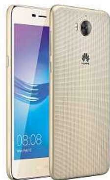
Huawei Y6 (2017) MIRONET

To vše je zabaleno v elegantním kabátku, podrženo tenkou a lehkou konstrukcí. Vybrat si můžete hned ze tří barev, takže si telefon perfektně sladíte s vaším stylem.