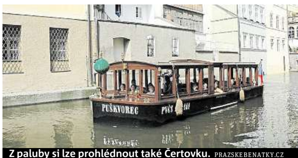
Z paluby si lze prohlédnout také Čertovku.