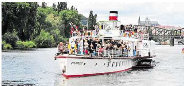
Parník Vyšehrad je nejstarší a největší parník na Vltavě.