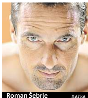
Roman Šebrle MAFRA

víc zakoupit originální dárky na webu Nezašastavitelní.cz, a přispět tak na speciální konto. Na kontě už je 185 440 korun a lidé na Sněžce mohou přidat další. MET