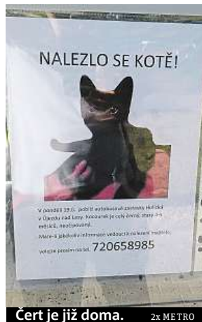
Čert je již doma.