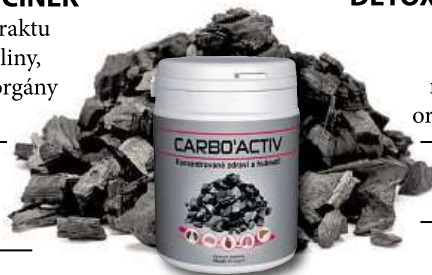
CARBO'ACTIV JE DOPLNĚK STRAVY.

Toxiny, odpad a léky, potravinové přísady... nic z toho, co zanáší váš organismus, mu neodolá!