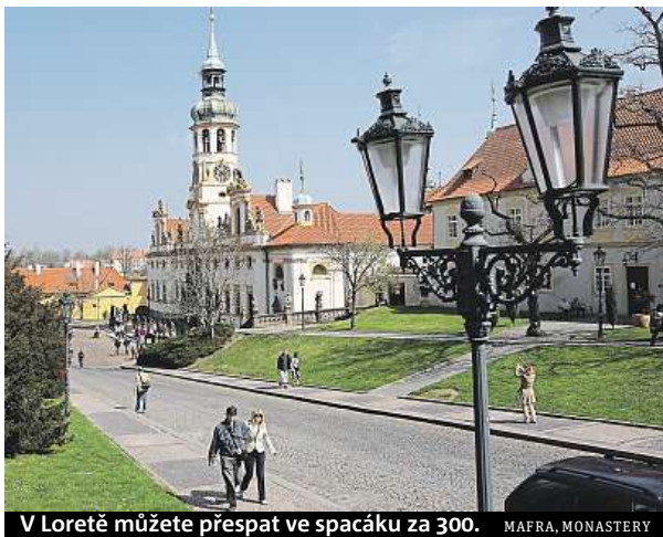
V Loretě můžete přespat ve spacáku za 300.