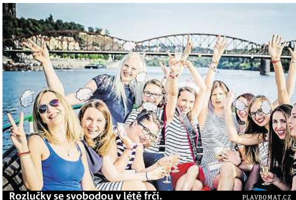
Rozlučky se svobodou v létě frčí. PLAVBOMAT.CZ

mlýny. Pokud dáváte před romantikou raději přednost pořádné party, právě pro vás je tu takzvaný Plavbomat. Ten funguje na principu „domluv si předem“, což platí nejen pro velikost lodí, počet lidí, program či občerstvení, ale také pro volbu večírkového tématu.