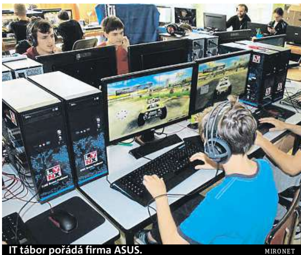
IT tábor pořádá firma ASUS.

Jestli přemýšlíte, jak ke konci prázdnin zabavit své děti, abyste si ušetřili aspoň týden sami pro sebe, máme pro vás zajímavý tip. Největší český IT e-shop Mironet ve spolupráci se světovým výrobcem