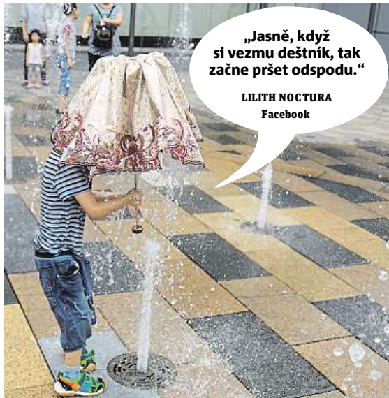
LILITH NOCTURA Facebook