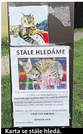
Karta se stále hledá.

O podobných příbězích jste během léta určitě slyšeli, často lze i zahlédnout plakát s prosbou o pomoc na ulici. Svůj podíl na tom mají především vyšší letní teploty, které zvířata ženou z nevětraných bytů ven za ochlazením, i dovolené, během nichž bývají mazlíčci bez dozoru. „Před pár týdny jsme u zastávky Hulická v pražském Újezdě nad Lesy našli neočipovaného, asi pětiměsíčního černého kocourka. Proto jsme také po okolí rozmístili celou řadu letáků, aby-