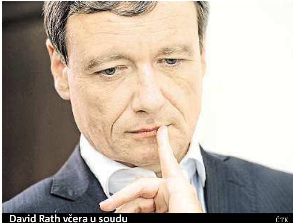
David Rath včera u soudu

David Rath ve své závěrečné řeči u soudu také zopakoval, že se necítí být vinný, obžaloba podle něj nepředložila jediný důkaz o tom, že by vědomě přijal úplatek. Došlo opět na pověstných sedm mi-