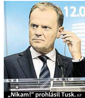
„Nikam!“ prohlásil Tusk.

Řecký premiér Alexis Tsipras a německá kancléřka Angela Merkelová se údajně po 14 hodinách rozhovorů plných utrpení rozhodli, že už není kam dál jít. Neviděli žádný prostor pro dosažení kompromisu ani důvod, proč v jednáních pokračovat. A odchod Řecka z eurozóny, takzvaný grexit, byl naprosto reálnou možností. Do kritické fáze se tak rozhovory dostaly včera kolem šesté hodiny ráno. Když už se oba lídři zvedli a šli ke dveřím, aby jednání