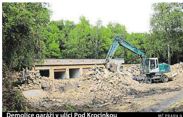
Demolice garáží v ulici Pod Krocínkou

Místní se nyní obávají jediného: co na nově uvolněném pozemku vznikne. „Doufám, že se zde vybuduje něco, co bude ladit s Klíčovským lesoparkem,“ doufá Karel Kýr, který bydlí v sousedství.