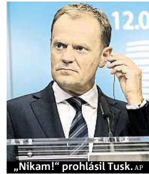
„Nikam!“ prohlásil Tusk.

Řecký premiér Alexis Tsipras a německá kancléřka Angela Merkelová se údajně po 14 hodinách rozhovorů plných utrpení rozhodli, že už není kam dál jít. Neviděli žádný prostor pro dosažení kompromisu ani důvod, proč v jednáních pokračovat. A odchod Řecka z eurozóny, takzvaný grexit, byl naprosto reálnou možností. Do kritické fáze se tak rozhovory dostaly včera kolem šesté hodiny ráno. Když už se oba lídři zvedli a šli ke dveřím, aby jednání