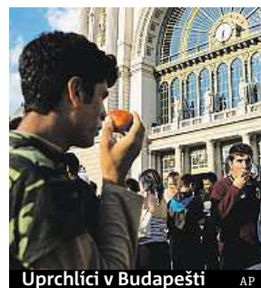
Uprchlíci v Budapešti

„Plot bude bránit Maďarsko a Evropskou unii před nečekaně velkým tlakem ilegální imigrace,“ uvedl již dříve maďar-