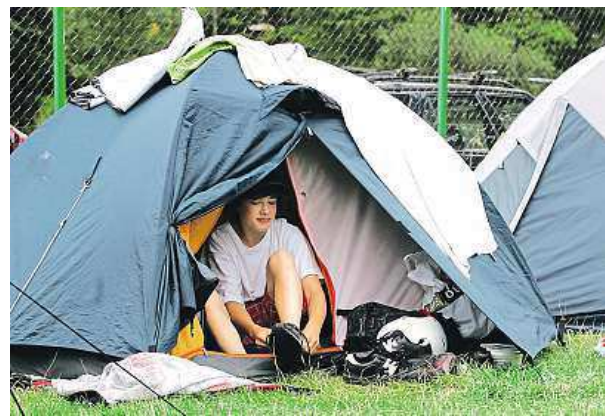
V případě potřeby lze stan i naimpregnovat.

O stan je také třeba se dobře starat, a prodloužit tak jeho životnost. „Stan je dobré skladovat především v suchu a temnu. Polyesterový stan má životnost pět až sedm let, bavlněný deset až dvanáct let, záleží na intenzitě užívání a kvalitě údržby,“ vysvětluje Skalka. Nezapomeňte na to, že při manipulaci se stanem musí-