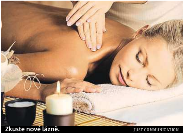
Zkuste nové lázně.

Přímo v centru tohoto krásného městečka, v hotelu Zlatá hvězda můžete navštívit konopné lázně. Nabízejí tu také konopné masáže či zábaly. V průběhu pobytu na