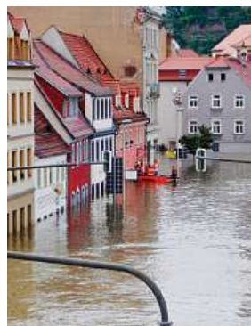
Povodňové mapy slouží jako prevence