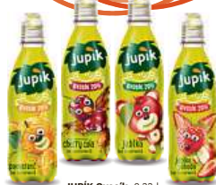
JUPIK Ovocik , 0,33 l Pomeranč, Jahoda, Cherry Cola, Jablko