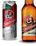
GAMBRIMUS, 0,5 l Originál 10 plech, lahev