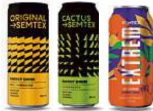
SEMTEX, 0,5 l Original, Cactus, Extrem