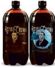
ROYAL CROWN COLA, 1,33 l Clasic, No Sugar