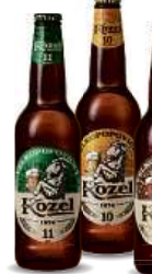
VP KOZEL, 0,5 l 11 medium, 10, Černý