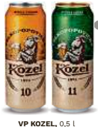
VP KOZEL, 0,5 l 10, 11 plech