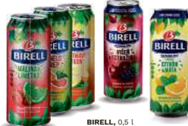
BIRELL, 0,5 l Limetka & Malina, Pomelo & Grep, Polotmavý Citrón, Višňe & Ostružina, Citrón & Máta