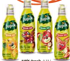
JUPIK Ovocik, 0,33 l Pomeranč, Jahoda, Cherry Cola, Jablko