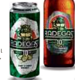
RADEGAST , 0,5 l Rázná 10, Ratar, 10 plech