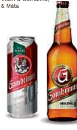
GAMBRIMUS , 0,5 l Originál 10 plech, lahev