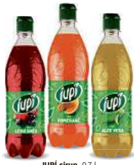
JUPI sirup , 0,7 l Lesní směs, Pomeranč, Aloe vera