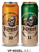
VP KOZEL , 0,5 l 10, 11 plech