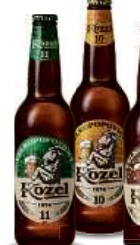
VP KOZEL , 0,5 l 11 medium, 10, Černý