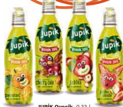
JUPIK Ovocik , 0,33 l Pomeranč, Jahoda, Cherry Cola, Jablko