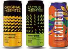
SEMTEX , 0,5 l Original, Cactus, Extrem