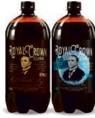
ROYAL CROWN COLA , 1,33 l Classic, No Sugar