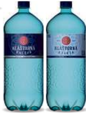
KLÁŠTORNÁ KALCIA , 1,5 l Jemná syčená, Syčená