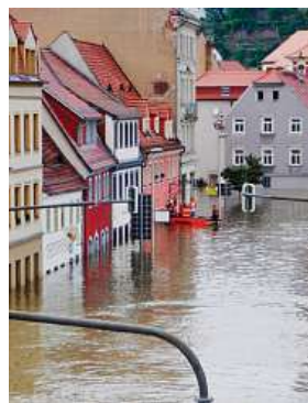
Povodňové mapy slouží jako prevence