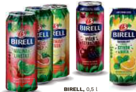
BIRELL , 0,5 l Limetka & Malina, Pomelo & Grep, Polotmavý Citrón, Višňe & Ostružina, Citrón & Máta