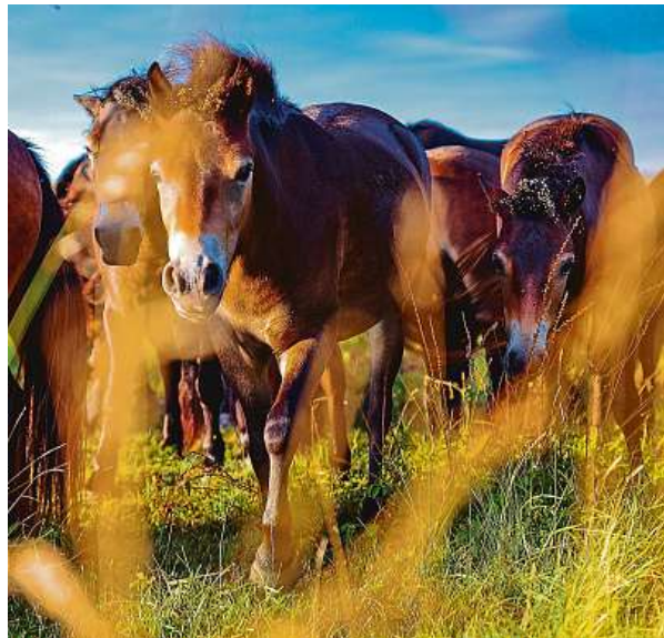
Exmoorské koně, původem z jihozápadní Anglie, se od 11. století chovají polodivokým způsobem.

Mezinárodní plemenná kniha v Česku eviduje 45 klisen a 70 hřebců k roku 2022, ze kterého jsou poslední celoevropská data. Všichni tito koně patří do chovného programu ochranné společnosti Česká krajina. V současné době se zvířata nacházejí v celkem 15 tuzemských rezervacích, které provozují další neziskové organizace, obce, města, kraje, soukromí