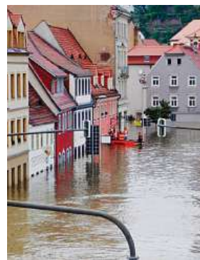
Povodňové mapy slouží jako prevence