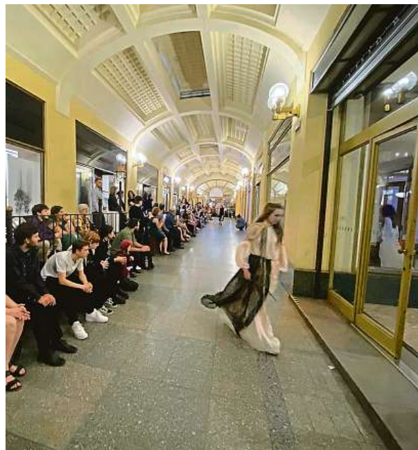
V pasáži domu U Nováků probíhá po celý rok řada akcí a výstav. Pocta španělskému malíři Picassovi začne zítra.