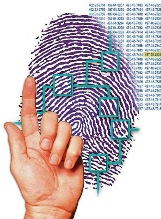
Dvaatřicetimístný kód, který rodné číslo nahradí, nebudeme znát. Nad změnou se pozastavují odborníci.

Důvody pro konec zápisu rodných čísel do občanských průkazů jsou dva – obsahují informace o našem pohlaví a věku a může snadno dojít k jejich zneužití. Nový systém bude postaven na 32místném takzvaném bezvýznamovém identifikátoru a čtyřech dalších kódech pro různé životní situace. Rodná čísla mají i nadále zůstat na pasích a řidičských průkazech.