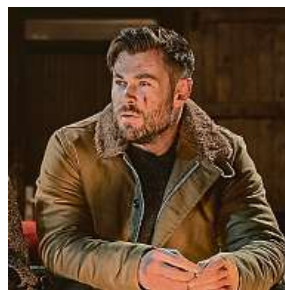
Roli zkušeného žoldáka hraje opět Chris Hemsworth.

Bylo tedy jen otázkou času, kdy streamovací gigant, na-