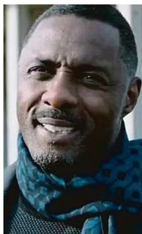
Role Idrise Elby má být v akčním snímku překvapivě klíčová.

STRÁŽCE STREAMU. NAŠE DOJMY Z NOVÉHO FILMU SI BUDETE MOCI PŘEČÍST V PÁTEK NA WEBU METRO.CZ