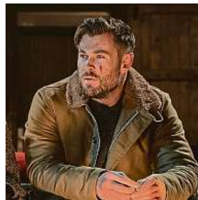
Roli zkušeného žoldáka hraje opět Chris Hemsworth.

Bylo tedy jen otázkou času, kdy streamovací gigant, na-