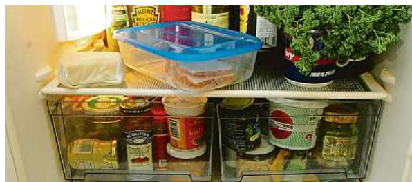
Pravidelný úklid a kontrola prošlých potravin v kancelářské kuchyňce jsou základní předpoklad, aby se předešlo nepříjemnostem. MAFRA

Hospodská kuchyně zavřená kvůli odstrašující hygieně. Takové situace hygienici znají. Ale s čistotou chladniček na tom jsou i v leckterých firmách špatně.