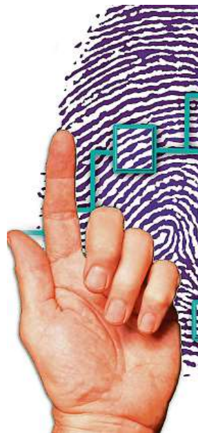
Kód, který rodné číslo nahradí, nebudeme znát.

Proti útlumu rodných čísel je i veřejnost – podle průzkumu Ipsos nepovažuje 85 % respondentů za nutné nahradit rodné číslo systémem mnoha identifikátorů.