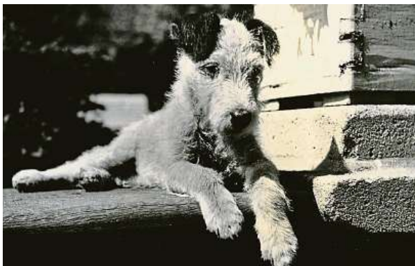
Nejznámější fotografie, kterou pořídil sám Karel Čapek.

„Dášeňka se narodila zřejmě v roce 1932, kniha poprvé vyšla roku 1933. Ze vzpomínek Olgy Scheinpflugové i dalších Čapkových blízkých víme, že šlo o velmi živé psisko, které kousalo, trhalo a ničilo skoro vše, na co přišlo. Jak je to ostatně u hrubosrstých foxteriérů zvykem. Fen-