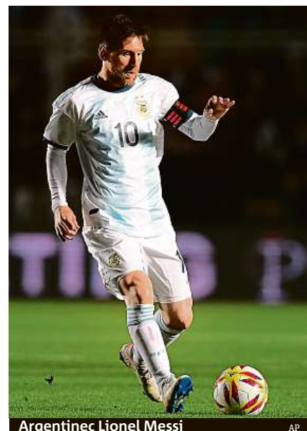
Argentinec Lionel Messi

„Kanárci“ dosud hostili Copu čtyřikrát a vždy si doma došli pro zlato. „Hrajeme ve své zemi a očekává se, že vyhrájeme. Odpovídá to tomu, jaké výkony předvádíme. Ale jestli skutečně vyhrájeme, to nevím,“ řekl brazilský trenér Tite. „Vzhledem k tomu, jaké hráče Brazílie má a že hraje doma, je pro všechny lidi na kontinentu favoritem,“ uvedl záložník Rodrigo De Paul z Argentiny. Ta dosud vyhrála jihoamerický šampionát čtrnáctkrát a může dotáhnout nejúspěšnější zemi Uruguay. Hvězdný útočník Messi sní o tom, že konečně dovede reprezentaci k velkému zlatu. Barcelonský kanonýr s Argentinou třikrát prohrál finále Cocy včetně posledních dvou jihoamerických šampionátů a jednou finále mistrovství světa. Zlatou medaili má jen z OH v Pekingu. „Jdeme do