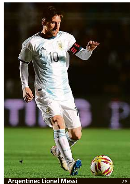
Argentinec Lionel Messi

„Kanárci“ dosud hostili Copu čtyřikrát a vždy si doma došli pro zlato. „Hrajeme ve své zemi a očekává se, že vyhrájeme. Odpovídá to tomu, jaké výkony předvádíme. Ale jestli skutečně vyhrájeme, to nevím,“ řekl brazilský trenér Tite. „Vzhledem k tomu, jaké hráče Brazílie má a že hraje doma, je pro všechny lidi na kontinentu favoritem,“ uvedl záložník Rodrigo De Paul z Argentiny. Ta dosud vyhrála jihoamerický šampionát čtrnáctkrát a může dotáhnout nejúspěšnější zemi Uruguay. Hvězdný útočník Messi sní o tom, že konečně dovede reprezentaci k velkému zlatu. Barcelonský kanonýr s Argentinou třikrát prohrál finále Cocy včetně posledních dvou jihoamerických šampionátů a jednou finále mistrovství světa. Zlatou medaili má jen z OH v Pekingu. „Jdeme do