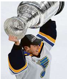
Jordan Binnington

razně podepsal brankář Jordan Binnington, který zastavil 32 střel a 16. výhrou v letošní vyřazovací části vytvořil nováček rekord soutěže. Conn Smythe Trophy pro nejužitečnějšího hráče play-off získal útočník Ryan O'Reilly, který si stejně jako Alex Pietrangelo a Jaden Schwartz připsal v utkání dva body. Spolu s Bradem Marchandem z Bruins se díky 23 bodům stal nejproduktivnějším hráčem vyřazovacích bojů. Obránce Jay Bouwmeester se stal 29. členem Triple Gold Clubu, který sdružuje vítěze Stanley Cupu a držitele zlata z MS a OH. ČTK