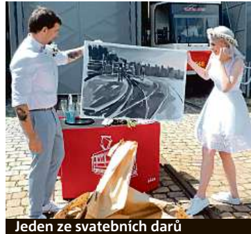
Jeden ze svatebních darů