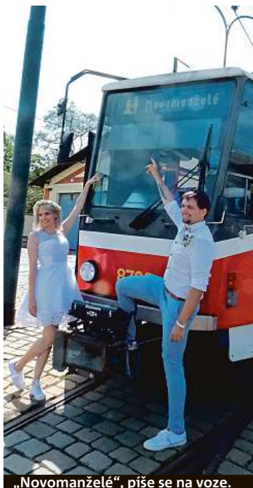
„Novomanželé“, píše se na voze.