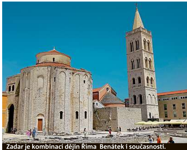
Zadar je kombinací dějin Říma Benátek i současnosti.

Ze zadarské nábrežní promenády je prý k vidění nejkrásnější západ slunce na Jadranu.