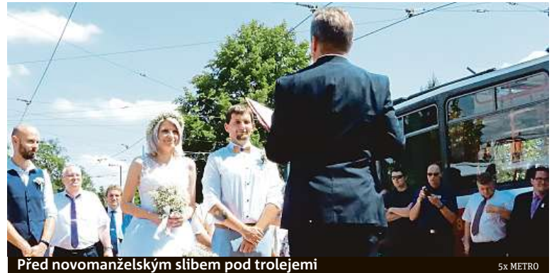
Před novomanželským slibem pod trolejemi

Pro Karolínu je řízení tramvajů prvním a, jak říká, i posledním zaměstnáním. V březnu se po více jak čtyřiceti letech stala další ženou, která úspěšně absolvovala kurz a získala oprávnění řídit staré dvouúpravové vozy. Po obřadu svatební hosté odjeli s kapelou slavnostně vyzdobenou tramvají T3 zvanou Měsíček. Novomanželé s dalšími hosty se pak vydali na cestu tramvají KT8D5 přezdívanou Kachna. Tentokrát ale neřídil ani jeden z nich. ŠK