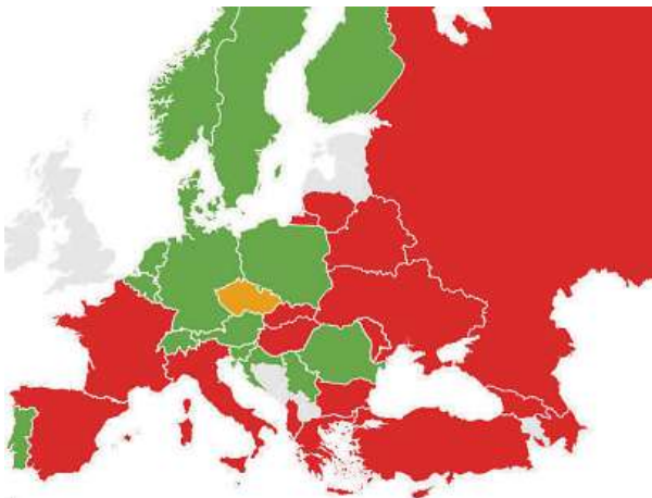
Zelené země se dorozumí lépe, červené hůře. EVROPA V DATECH

Další sousedé Česka, tedy Němci a Rakušané, patří se svým skóre do nejlépe hodnocené skupiny zemí s „velmi vysokou“ znalostí angličti-