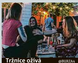
Tržnice ožívá @BURZA4

Holešovická tržnice prochází postupnou proměnou. Míží načerno postavené stánky a přicházejí