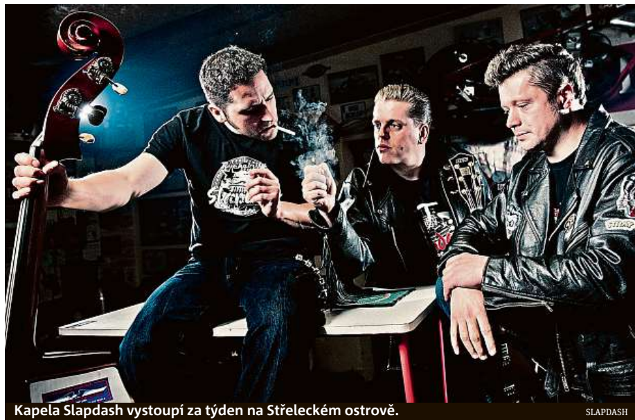
Kapela Slapdash vystoupí za týden na Sšteleckém ostrově.