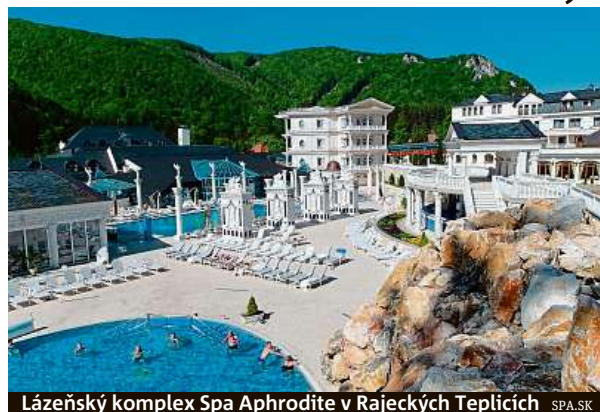
Lázeňský komplex Spa Aphrodite v Rajeckých Teplících SPA.SK

Pokud budete mít více času, rozhodně se vydejte do Súľovských skal, které už jsou v Malé Fatře, i na místní hrad. Nenechte si ujit vstup slavnou Gotickou branou nebo pozoruhodný skalní útvar nazvaný Stratený Budzogaň (česky kyj, pozn. redakce). Dvanáct metrů vysoká hříčka