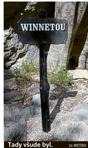
Tady všude byl.

V programu pohybově aktivních pamětníků kovbojek o Vinnetouovi by neměl scházet výlet do Národního parku Paklenica (asi 50 kilometrů severovýchodně od Zadaru). Zdejší skaliska a kaňony poskytl před půl stoletím exteriéry pro natočení těchto romantických indiánek. Místa důležitých záběrů označují výrazné cedule. Šplushochopné mladší generace sem ale míří spíše za příkrými stěnami. Skály nabízejí celkem čtyři stovky značených výstupů od nejnižší po nejvyšší stupeň obtížnosti. Jednodenní vstupné je za 60 kun na osobu, tři dny přebývání ve skalních masivech vyjdou na dvojnásobek. PAVEL HRABICA