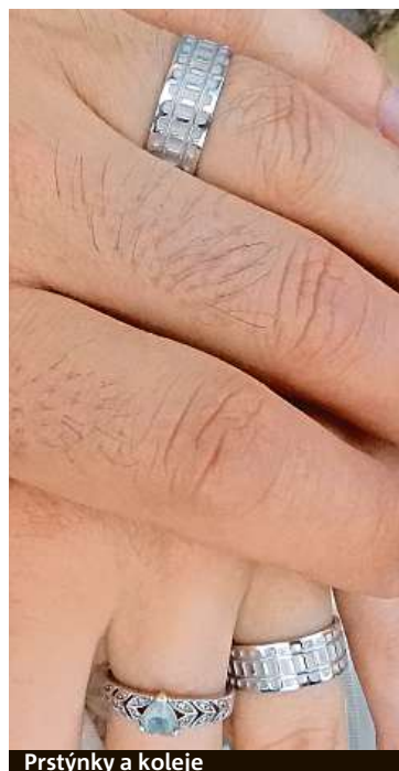
Prstýnky a koleje

Zlatá horečka se rozpoutala v Galerii Myšák v ulici Vodičkova. VE ZLATNICTVÍ SHERRI VYKUPUJÍ ZLATO MIMOŘÁDNĚ VÝHODNĚ.