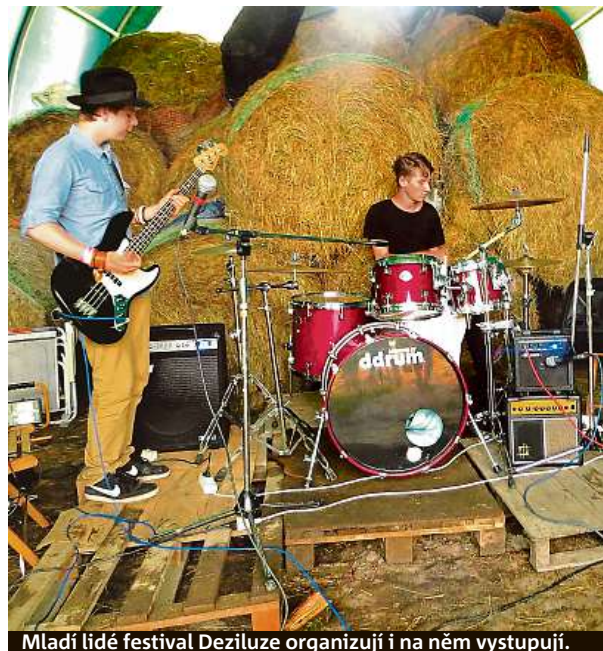
Mladí lidé festival Deziluze organizují i na něm vystupují.