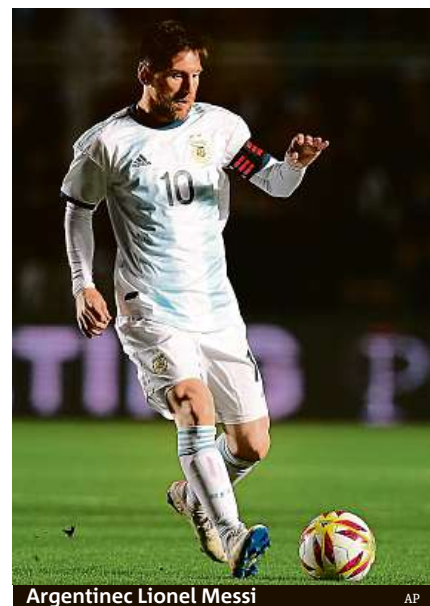
Argentinec Lionel Messi

„Kanárci“ dosud hostili Copu čtyřikrát a vždy si doma došli pro zlato. „Hrajeme ve své zemi a očekává se, že vyhrájeme. Odpovídá to tomu, jaké výkony předvádíme. Ale jestli skutečně vyhrájeme, to nevím,“ řekl brazilský trenér Tite. „Vzhledem k tomu, jaké hráče Brazílie má a že hraje doma, je pro všechny lidi na kontinentu favoritem,“ uvedl záložník Rodrigo De Paul z Argentiny. Ta dosud vyhrála jihoamerický šampionát čtrnáctkrát a může dotáhnout nejúspěšnější zemi Uruguay. Hvězdný útočník Messi sní o tom, že konečně dovede reprezentaci k velkému zlatu. Barcelonský kanonýr s Argentinou třikrát prohrál finále Cocy včetně posledních dvou jihoamerických šampionátů a jednou finále mistrovství světa. Zlatou medaili má jen z OH v Pekingu. „Jdeme do