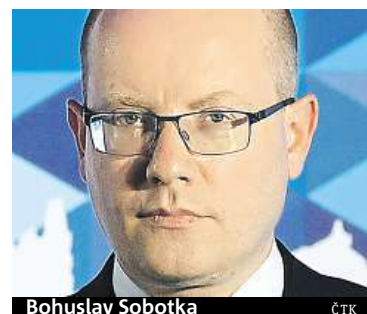
Bohuslav Sobotka

Dnes by mělo být jasněji, zda sociální demokracii a její kampaň do letošních sněmovních voleb i nadále povede premiér Bohuslav Sobotka. Spekulace o tom, že by se mohl Sobotka vzdát funkce předsedy ČSSD a volebního lídra, zesílily v posledních dnech po sérii několika předvolebních průzkumů, z nichž poslední přisoudil ČSSD jen desetiprocentní zisk hlasů. V kuloárech se mluví o tom, že by se vedení strany mohl ujmout ministr zahraničí Lubomír Zaorálek nebo vnitra Milan Chovanec. K Sobotkovu odchodu se vyjádřil i předseda jihočeské ČSSD a někdejší hejtman Jiří Zimola, jeden z těch, který se před čtyřmi lety zúčastnil tajného jednání s prezidentem Milošem Zemanem. Už tehdy Zimola a jeho kolegové – Michal Hašek, Milan Chovanec, Zdeněk Škromach, Jeroným Tejc – chtěli So-