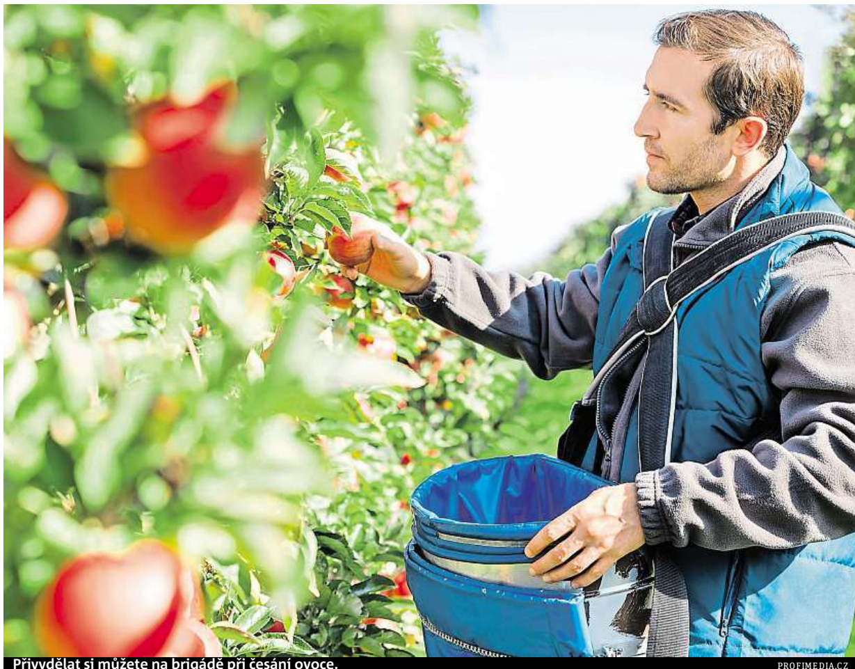
Přivydělat si můžete na brigádě při česání ovoce.

Velmi ostrážitíťi buďte při sjednávání práce v zahraničí. Důrazně doporučujeme zjistit si předem, zda a za jakých podmínek nabízí zaměstnavatel ubytování a jak je to s pojištěním a povinnými od-