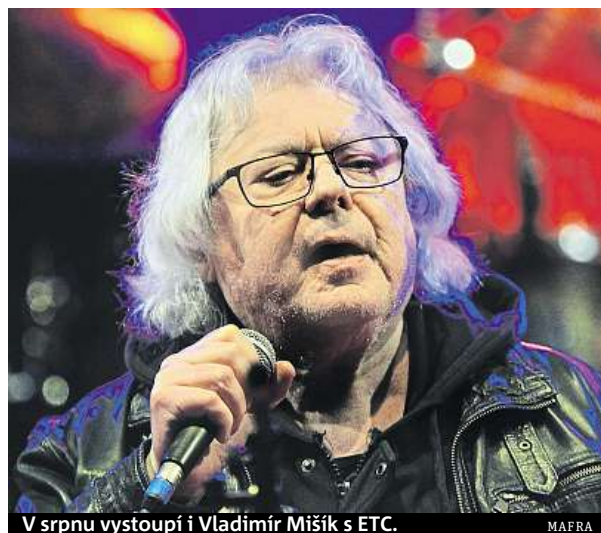
V srpnu vystoupí i Vladimír Mišík s ETC.

Ten, kdo chce spojit hudební zážitek s gurmánským, může zavítat v pátek a v sobotu na dvoudenní Jazz & Wine Fest, kromě dobrého jídla a vína si může užít řadu hudebních vystoupení. IBE