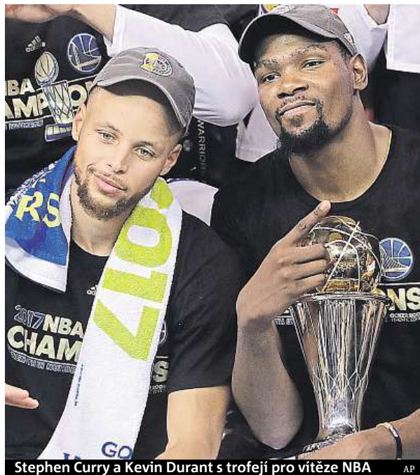
Stephen Curry a Kevin Durant s trofejí pro vítěze NBA

Za dvě vstupenky na sedačky přímo u palubovky na pátý finálový zápas NBA zaplatil nejmenovaný nadšenec rekordních 133 tisíc dolarů (což je 3,1 milionu korun).