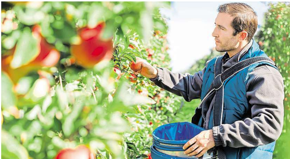
Přivydělávat si můžete na brigádě při česání ovoce.

Asi první možnosti, která každého napadne, je podívat se na nabídku míst na pracovních portálech. Práci na léto je možné hledat i prostřednictvím sociálních sítí, ale například LinkedIn využijete spíše v případě, že chcete jako vysoko-