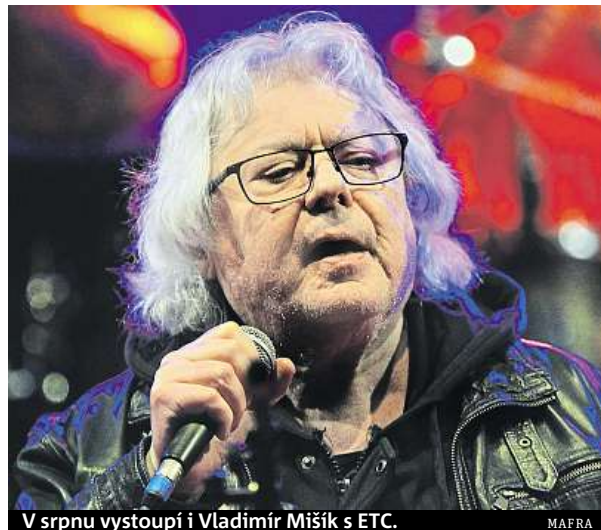
V srpnu vystoupí i Vladimír Mišík s ETC.

Ten, kdo chce spojit hudební zážitek s gurmánským, může zavítat v pátek a v sobotu na dvoudenní Jazz & Wine Fest, kromě dobrého jídla a vína si může užít řadu hudebních vystoupení. IBE