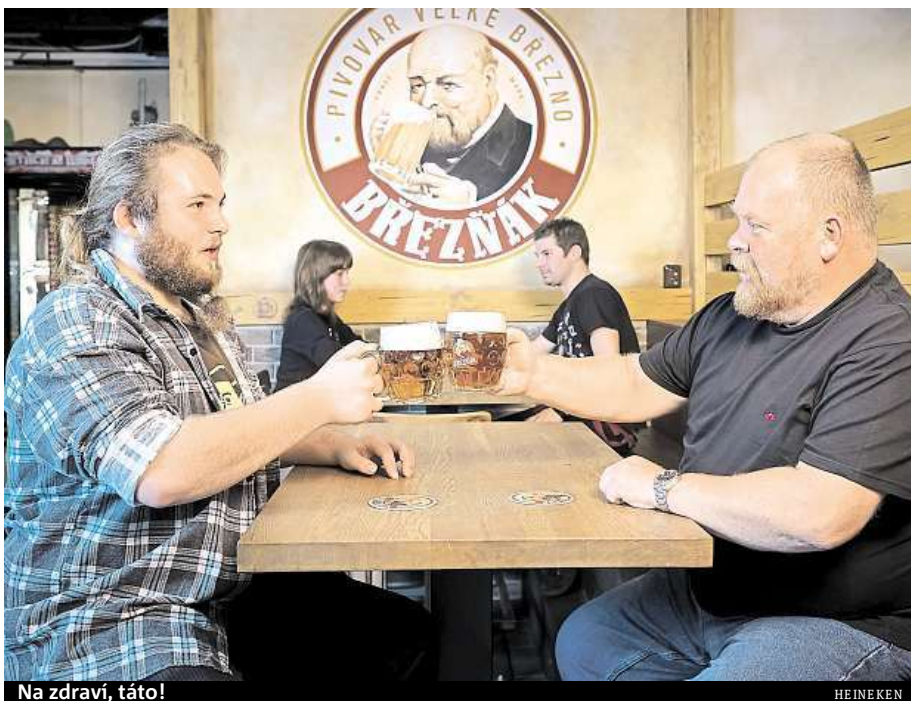
Na zdraví, táto!

Značka Břežňák z pivovaru ve Velkém Březně vyznává a ctí hodnoty „staré školy“, jako jsou tradice, poctivost, zkušenost nebo vztah k domovu. Sází na mezigenerační výzvu a poukazuje na to, že zrychlující se tempo a roz-