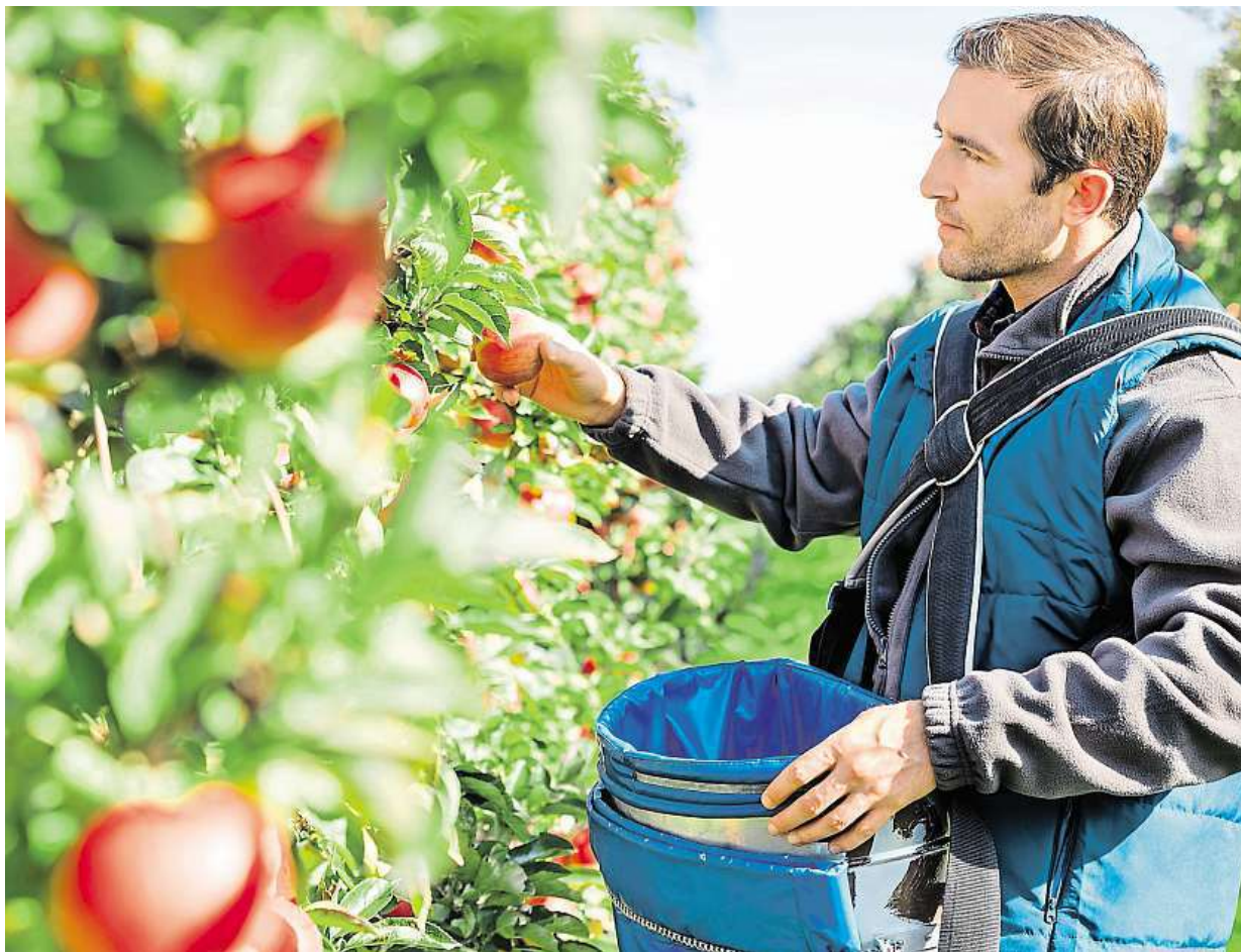
Přivýdělat si můžete na brigádě při česání ovoce.

Velmi ostražití buďte při sjednávání práce v zahraničí. Důrazně doporučujeme zjistit si předem, zda a za jakých podmínek nabízí zaměstnavatel ubytování a jak je to s pojištěním a povinnými od-