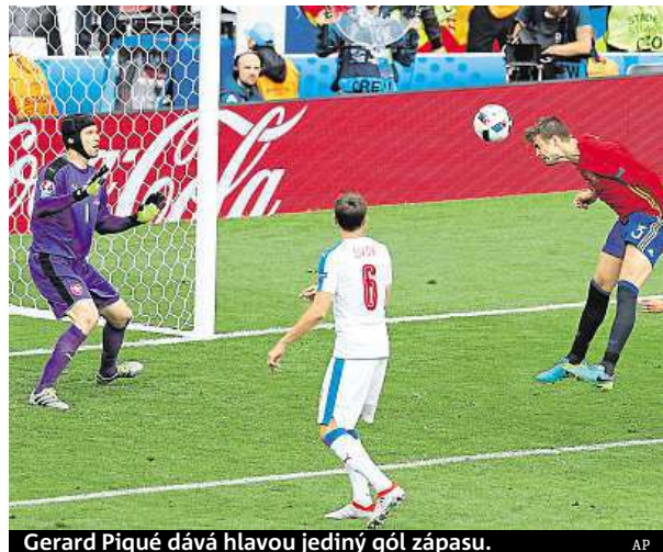
Gerard Piqué dáva hlavou jediný gól zápasu.