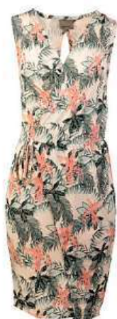
VERO MODA dámské šaty

na oblečení, obuv a doplňky, domácí a kuchyňské potřeby, hračky a papírnictví