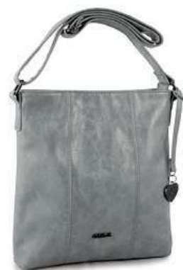
FAMITO dámská kabelka různé druhy