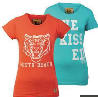
dámské tričko různé barvy