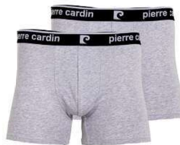
pierre cardin pánské boxerky 2 ks různé barvy