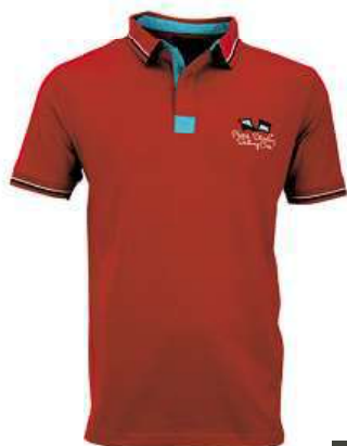
pierre cardin pánské polo tričko různé barvy