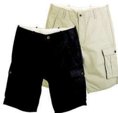
Levi's life is calling pánské kraťasy různé barvy