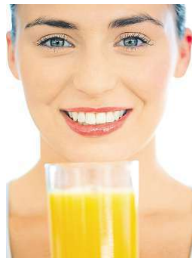
Džusy příjemně osvěží.

„Pokud nemáte zvýšenou fyzickou námahu ani nejsou tropická vedra, doporučuji vypít přibližně 150 mililitrů tekutin každou hodinu. V průběhu celého dne pak střídát různé druhy. K snídani jsou vhodné například čaje a ředěné stoprocentní ovocné džusy. Odpoledne je výhodnější zaměřit se na džusy zeleninové a samozřejmě největší podíl tekutin má být voda. Děti a senioři navíc nemají tak silný pocit žízně, proto je u nich třeba příjem tekutin hlídat,“ říká Martin Hrazdil, fitness trenér a nutriční poradce spolupracující se značkou Relax. Tekutiny ale můžete doplnit také pomocí pravidelného přísunu ovoce a zeleniny. Mělo by jít až o pět menších porcí denně. Jde totiž o přirozený zdroj vitamínů a minerálních látek včetně vitamínu C, draslíku a kyseliny listové. Ovoce a zelenina jsou vynikajícím zdrojem vlákniny, přispívají také ke zdravé rovnováze jídelníčku. Obsahují minimum tuku a žádný cholesterol.