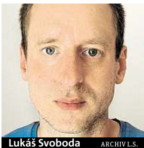
Lukáš Svoboda ARCHIV L.S.

Nový web lidem prozradí plány jejich radnice.