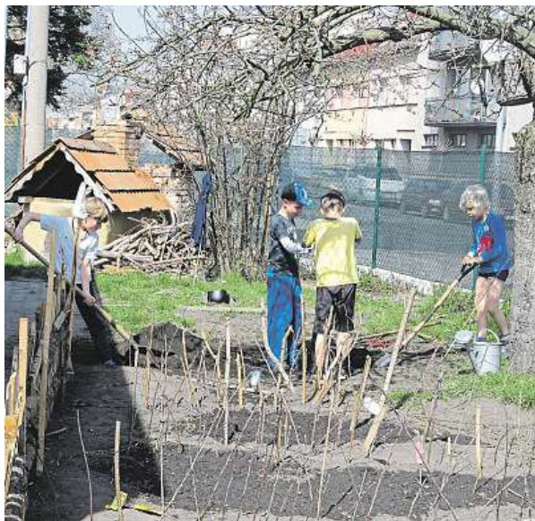
Děti na ZŠ Waldorfská v Pardubicích zahradničí rádi. SZS

Základní škola Waldorfská je napojena na bezplatný program Skutečně zdravá škola, který pomáhá školám i škol-