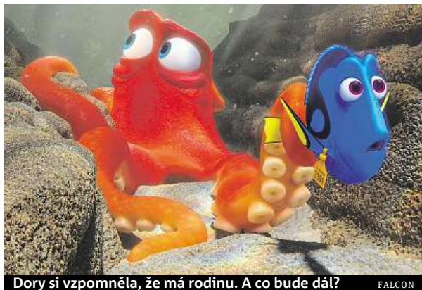
Dory si vzpomněla, že má rodinu. A co bude dál? FALCON

Pak si ale Dory z ničeho nic vzpomene, že kdysi a kdesi ztratila své rodiče. „Trpím výpadky krátkodobé paměti. Máme to v rodině... jestli si dobře vzpomínám. Hmm... Kde mám rodinu?“ Společně s Marlinem a Nemo se vydá na strhující dobrodružství napříč oceánem, které je zavede až do prestižního Mořského akvária v Kalifornii, kde