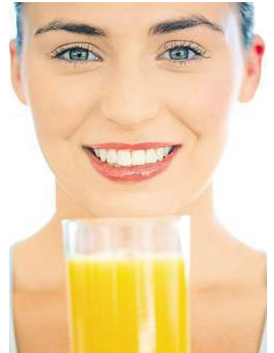
Džusy příjemně osvěží.

„Pokud nemáte zvýšenou fyzickou námahu ani nejsou tropická vedra, doporučuji vypít přibližně 150 mililitrů tekutin každou hodinu. V průběhu celého dne pak střídát různé druhy. K snídani jsou vhodné například čaje a ředěné stoprocentní ovocné džusy. Odpoledne je výhodnější zaměřit se na džusy zeleninové a samozřejmě největší podíl tekutin má být voda. Děti a senioři navíc nemají tak silný pocit žízně, proto je u nich třeba příjem tekutin hlídat,“ říká Martin Hrazdil, fitness trenér a nutriční poradce spolupracující se značkou Relax. Tekutiny ale můžete doplnit také pomocí pravidelného přísunu ovoce a zeleniny. Mělo by jít až o pět menších porcí denně. Jde totiž o přirozený zdroj vitamínů a minerálních látek včetně vitamínu C, draslíku a kyseliny listové. Ovoce a zelenina jsou vynikajícím zdrojem vlákniny, přispívají také ke zdravé rovnováze jídelníčku. Obsahují minimum tuku a žádný cholesterol.