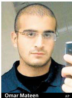
Omar Mateen

Podle evropského tisku může masakr v USA pomoci Donaldu Trumpovi.