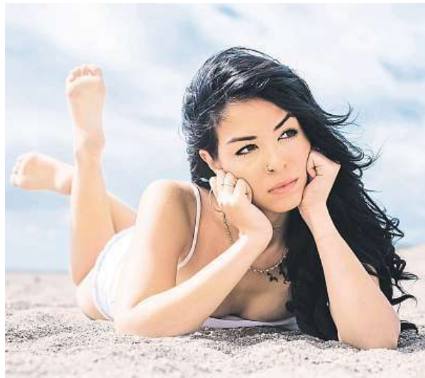
Plíseň postihuje nejdříve zpravidla palec u nohy.

Důležité je i ošetřování nehtové ploténky: zkrácení nehtu na nejkratší možnou délku, zbrusování pilníkem či pemzou a koupání v octové vodě. Pokud tato léčba nezbere, přistupují lékaři k celkové protiplísňové léčbě po-