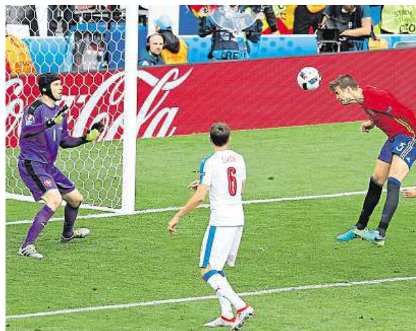
Gerard Piqué dáva hlavou jediný gól zápasu.

Dlouho očekávaný duel v Toulouse se odehrával podle předpokladů. Obhájcí titulu měli územní převahu a Češi se většinou jen bránili. Inkasovali až v 87. minutě.