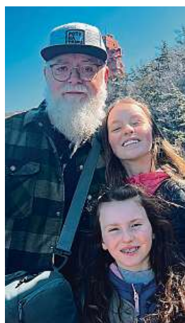
Prašťený fotr a jeho malé cestovatelské parťáčky