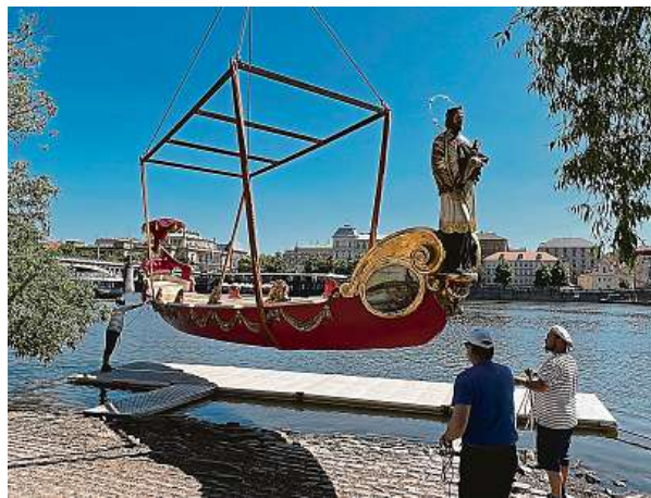
Loď je součástí zítřejšího programu. Na Vltavě pluje od včera.

Svatý Jan Nepomucký, který na přídi unikátní osmivěslce symbolizuje Prahu, je nejen světově známým světce, ale jako jeden z patronů Benátek je i hlavním pojátkem mezi Prahou a severoital-