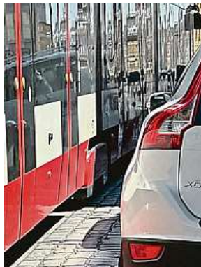
Pozor na zrcátko. Může jít o milimetry od tramvaje.

Deník Metro oslovil další řidiče tramvají a ti potvrzují, že se špatným parkováním, které je buď zastaví úplně, anebo je donutí několik vteřin jet velice opatrně, se setkávají poměrně často. Řešení speciálně v ulici Milady Horákové mají místní obyvatelé i náhodní kolemjdoucí. Auto chytanou, rozkymácí ho a od kolejí posunu. I když ne vždy. „Samozřejmě často u nich panuje obava z pochopitelných důvodů – hrozí poškození, všude jsou kamery,