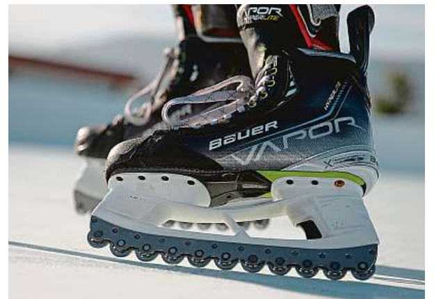
Kluziště ve Žlutých lázních nabízí unikátní bruslařský zážitek. TAIKO