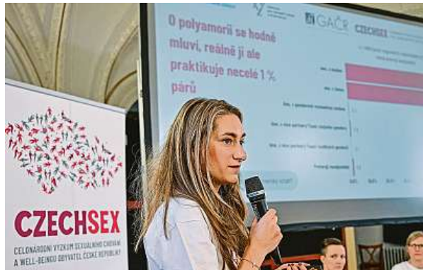
O volných soužitích v několika milostných vztazích se podle Markéty Šetinové z institutu Moderní láska víc mluví, než kolik jich je.

Mezi nejčastější tématy v diskusích patří bezesporu sexuální výkonnost. Z dlouhodobého hlediska se nemusejí Češi stydět, nijak nevybo-