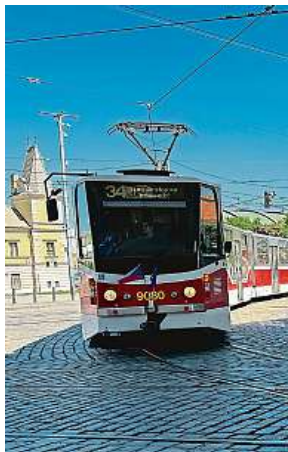
Pravidlo „tří kostek“ ovšem neplatí v zatáčkách, kdy se tramvaj ze své dráhy vychýlí. V jiných případech platí jeden panel, jedna kostka.