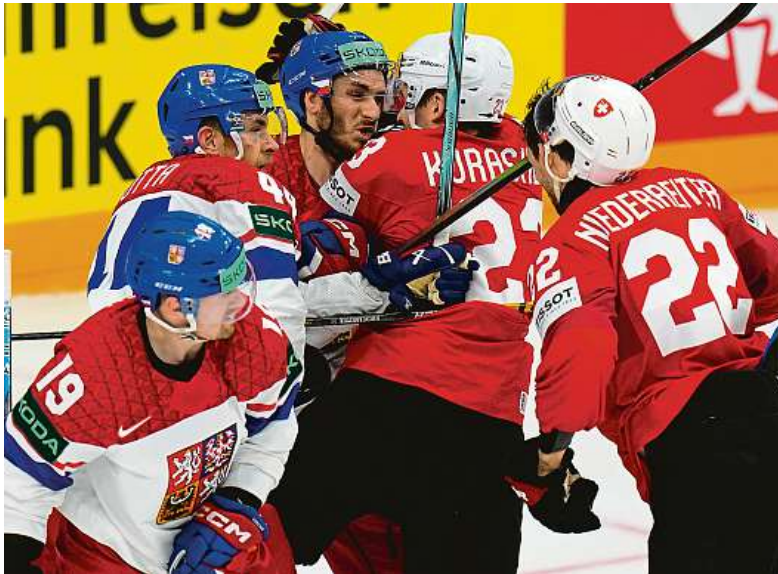
Emoce na ledě. Souboj Česka se Švýcarskem přinesl řadu osobních soubojů včetně hromadné bitky v závěru druhé třetiny. Oba góly ze hry padly v početných výhodách, nakonec však byli šťastnější Švýcaři, kteří proměnili dva z pěti samostatných nájezdů. Češi jen jeden.

Světová golfová jednička Nelly Kordová rekordní šestý titul na LPGA v řadě nezískala. Na turnaji Cognizant Founders Cup v Cliftonu ve státě New Jersey skončila na dělném sedmém místě. Vyhrála jiná Američanka – Rose Zhangová, za kterou dcera někdejšího českého tenisty zaostala o 17 ran. Kordové nevyšla víkendová kola, kde zahrála shodně 73 ran, jednu nad par.