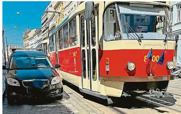
Stačí dodržovat pravidlo „tří kostek“. Jako v tomto případě na Letné, i když místo pro auta naznačuje čára, jsou tu často problémy. 4x METRO