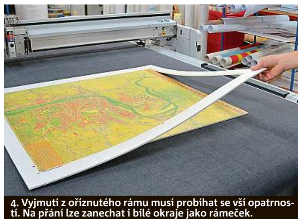
4. Vyjmutí z oříznutého rámu musí probíhat se vši opatrností. Na přání lze zanechat i bílé okraje jako rámeček.