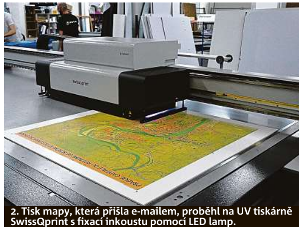
2. Tisk mapy, která přišla e-mailem, proběhl na UV tiskárně SwissQprint s fixací inkoustu pomocí LED lamp.