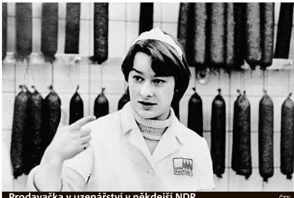
Prodávačka v uzenářství v někdejší NDR