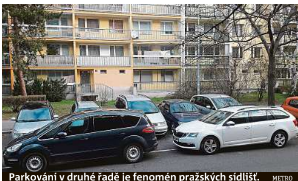
Parkování v druhé řadě je fenomén pražských sídlišť.

„Na povinnost řídiče ponechat při stání tři metry pruhu se na sídlištích nikdy nehrálo,“ říká strážnice.