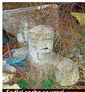
Sedící socha se vrací. PRAHA 4

Dílo umělce Milošlava Chlupáče, jež dříve zdobilo Prahu 4, objevil řeporyjský místostarosta.