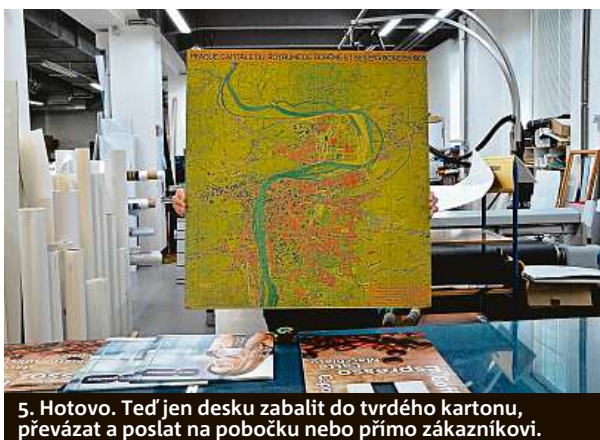
5. Hotovo. Teď jen desku zabalit do tvrdého kartonu, převázat a poslat na pobočku nebo přímo zákazníkovi.