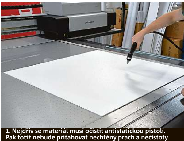
1. Nejdřív se materiál musí očistit antistatickou pistolí. Pak totiž nebude přitahovat nechtěný prach a nečistoty.