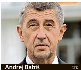
Andrej Babiš

Premiér mluvil o snížení daně na květiny. Nyní jeho svěřenecký fond ovládne síť květinářství Flamengo.