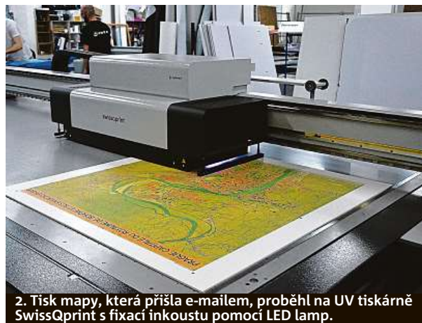
2. Tisk mapy, která přišla e-mailem, proběhl na UV tiskárně SwissQprint s fixací inkoustu pomocí LED lamp.