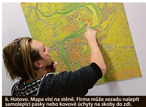
6. Hotovo. Mapa visí na stěně. Firma může ze zadu nalepit samolepící pásky nebo kovové úchyty na skoby do zdi.