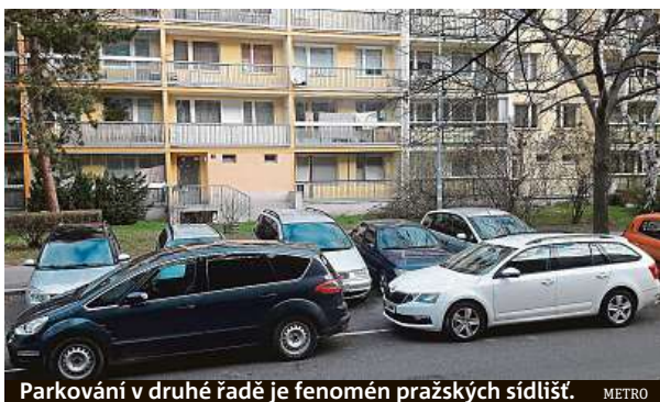
Parkování v druhé řadě je fenomén pražských sídlišť. METRO

„Na povinnost řidiče ponechat při stání tři metry pruhu se na sídlištích nikdy nehrálo,“ říká strážnice.