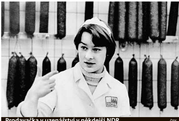
Prodávka v uzenářství v někdejší NDR