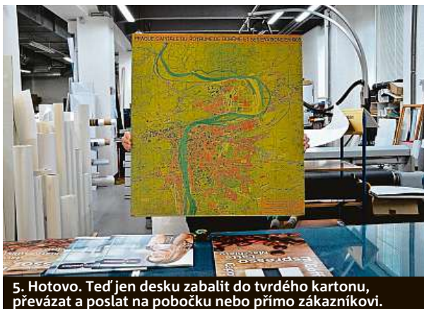
5. Hotovo. Teď jen desku zabalit do tvrdého kartonu, převázat a poslat na pobočku nebo přímo zákazníkovi.