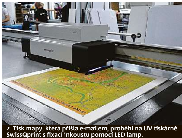
2. Tisk mapy, která přišla e-mailem, proběhl na UV tiskárně SwissQprint s fixací inkoustu pomocí LED lamp.