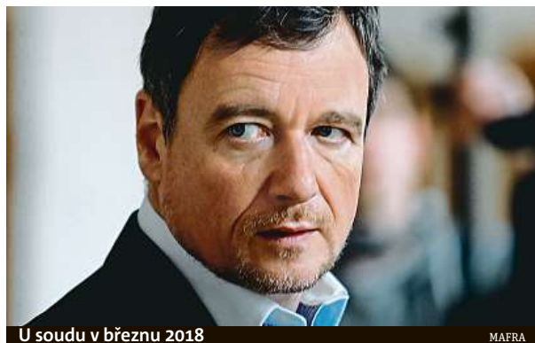
U soudu v březnu 2018