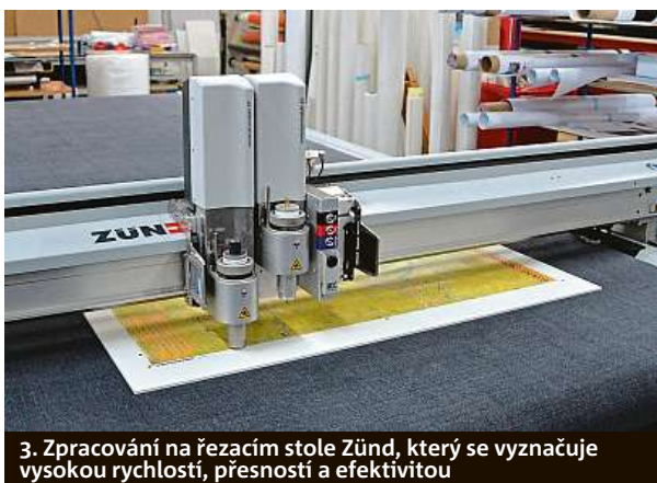
3. Zpracování na řezacím stole Zünd, který se vyznačuje vysokou rychlostí, přesností a efektivitou