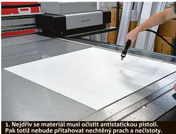
1. Nejdřív se materiál musí očistit antistatickou pistolí. Pak totiž nebude přitahovat nechtěný prach a nečistoty.