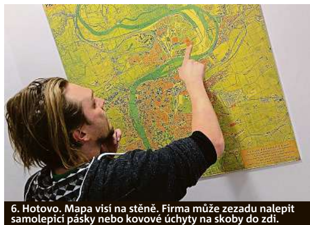
6. Hotovo. Mapa visí na stěně. Firma může ze zadu nalepit samolepící pásky nebo kovové úchyty na skoby do zdi.