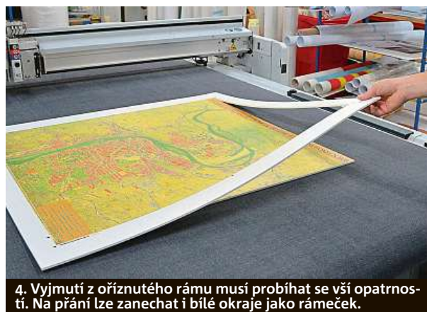
4. Vyjmutí z oříznutého rámu musí probíhat se vší opatrností. Na přání lze zanechat i bílé okraje jako rámeček.