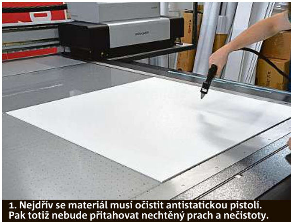
1. Nejdřív se materiál musí očistit antistatickou pistolí. Pak totiž nebude přitahovat nechtěný prach a nečistoty.