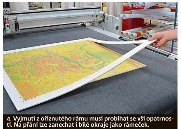
4. Vyjmutí z oříznutého rámu musí probíhat se vší opatrností. Na přání lze zanechat i bílé okraje jako rámeček.