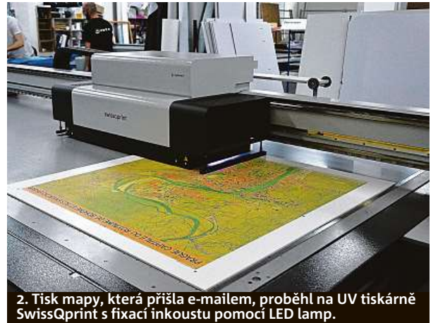
2. Tisk mapy, která přišla e-mailem, proběhl na UV tiskárně SwissQprint s fixací inkoustu pomocí LED lamp.