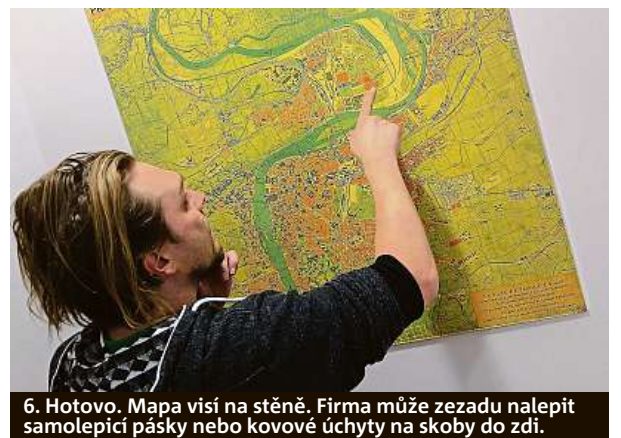
6. Hotovo. Mapa visí na stěně. Firma může ze zadu nalepit samolepící pásky nebo kovové úchyty na skoby do zdi.