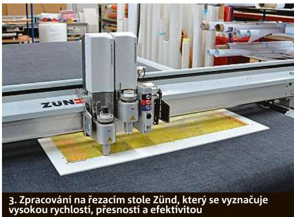
3. Zpracování na řezacím stole Zünd, který se vyznačuje vysokou rychlostí, přesností a efektivitou