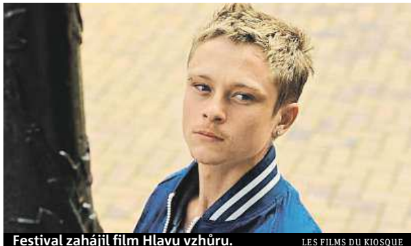
Festival zahájil film Hlavu vzhůru.

Bylo dlouhodobým zvykem, že film, který zahajoval nejslavnější filmovou přehlídku v Evropě, měl velký rozpočet a alespoň jednu velkou hvězdu – minulý rok Nicole Kidmanovou (Grace, kněžna monacká), předloni Leonarda DiCapria (Velký Gatsby). Letošní zahajovací film Hlavu vzhůru je však sociálním dramatem a jeho tvůrcem je žena – Emmanuelle Bercotová. Na tom by nebylo zase nic až tak zvláštního, kdyby film natočený ženou nezahajoval festival v Cannes naposledy v roce 1987.