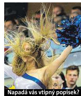
Napadá vás vtipný popísek?

Napište bublinu a reagujte na sloupek na: www.facebook.com/denikmetro