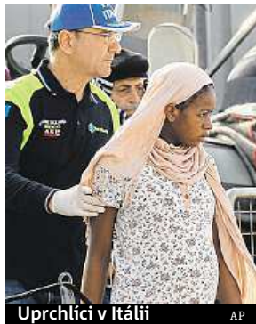
Uprchlíci v Itálii

Schulz však nastavuje zemím EU zrcadlo: „Myslím si, že devadesát procent všech uprchlíků přijme desítky zemí. Zbýlých osmnáct nedě-