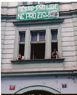
V Senovážné