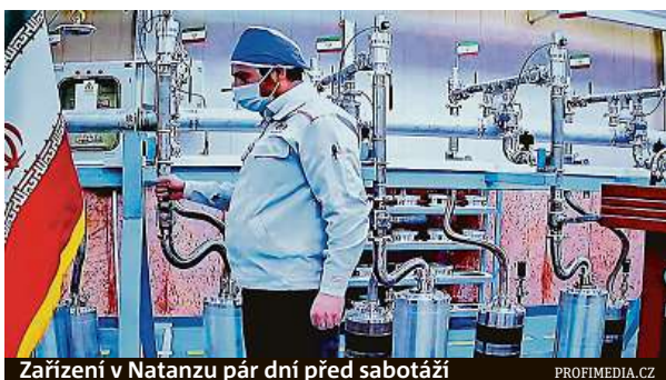
Zařízení v Natanzu pár dní před sabotáží