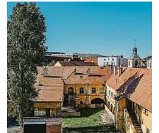
Dominikánský dvůr (2019)

Prázdných usedlostí a významných domů, které v minulosti obývali squatery, je v hlavním městě ještě velké množství.