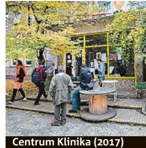
Centrum Klinika (2017)

Bývalá plicní klinika na Žižkově je patrně nejznámějším bývalým sídlem squaterů v tuzemsku. Budova neplnila svůj původní účel od roku 2009, a tak se sem v roce 2014 bez povolení nastěhovali aktivisté. Následně vzniklo Autonomní sociální centrum Klinika, kde se konaly kulturní akce a komunitní setkání. Po nátlaku úřadů uzavřeli zakladatelé Kliniky v roce 2015 dočasnou smlouvu o výpůjčce s Úřadem pro zastupování státu ve věcech majetkových. Ta jim umožňovala v budově setrvat rok. V mezičase přešlo vlastnictví obsazené budovy do rukou Správy železnic, která žádala po uplynutí lhůty její okamžité vyklizení. Po řadě výzev začali exekutorští úředníci v lednu 2019 s vyklizením. Někteří aktivisté i přesto zůstali na střeše a opustili budovu až několik dní poté.