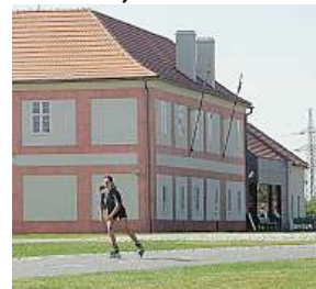
Ladronka, rok 2006 5x MAFRA

Šestá městská část měla na svém území ne jeden, ale