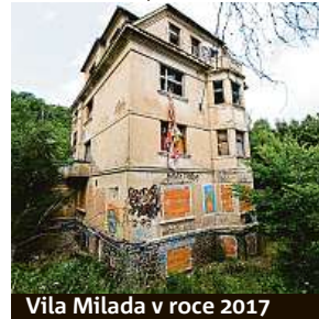
Vila Milada v roce 2017