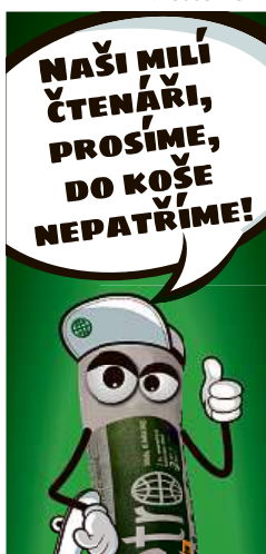
Knihy a časopisy

• Prodám družstevní byt 3+1, Praha 9 - Černý Most. RK nevolat! Info na tel.: 725995885.