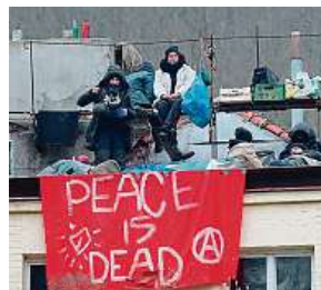
Na střeše Šatovky (2018)

Bývalá bašta squaterů Šatovka v Šáreckém údolí má za sebou bohatou historii. V polovině dvacátého století například sloužila jako bytový dům, již deset let je nicméně prázdná a čeká se, co s ní bude. Několikrát ji obsadili i squatery. Nejznámější je tři roky starý případ – desítky lidí vylezla na střechu a odmítala odejít. Po několika dnech však slezli dolů a zadržela je policie. Nyní má Šatovka další problém. Praha 6 zde chce zřídit centrum pro seniory. Brání jí v tom však složité vlastnické vztahy.