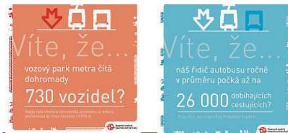
Tabulky, které přibližovaly zákulisí provozu metra