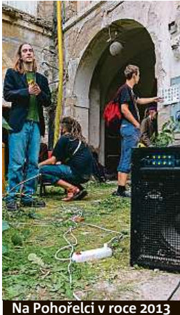
Na Pohořelci v roce 2013

Squateri tehdy obsadili budovy v ulici Křížkově, Křesomyslově, na Pohořelci, v Přístavní, Rytířské, Washingtonově, Dukelských hrdinů a také vyšehradské nádraží.