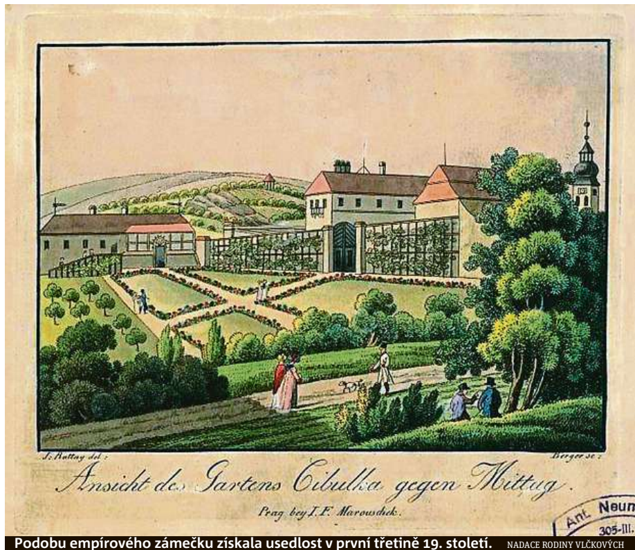
Podobu empírového záměčku získala usedlost v první třetině 19. století.