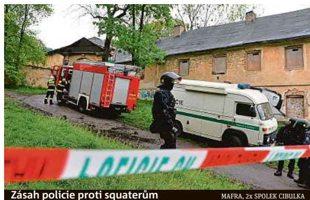
Zásah policie proti squaterům