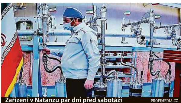
Zařízení v Natanzu pár dní před sabotáží

Jen málokdo pochybuje, kdo za nedělní sabotáží stojí. Izrael. „Tel Aviv podíl na podobných akcích oficiálně nepřiznává, ale novinářům to mimo záznam většinou potvrdí zdroje z izraelských či amerických bezpečnostních kruhů,“ uvádí politolog Jakub König. „Politici to nepopírají –