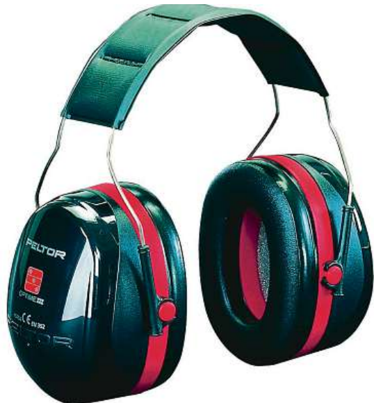
Mušlové chrániče sluchu

Prvním příznakem potíží se sluchem může být například zvonění v uších, ztráta rovnováhy nebo častější zapo-