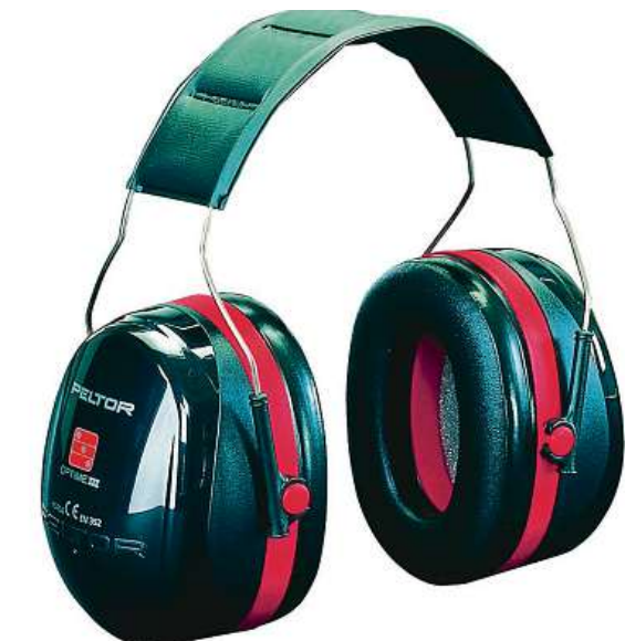
Mušlové chrániče sluchu

Prvním příznakem potíží se sluchem může být například zvonění v uších, ztráta rovnováhy nebo častější zapo-