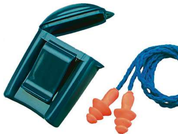
Zátkové chrániče sluchu

roveň je odpovědný i za kontrolu, zda jsou tyto prostředky správně udržovány a používány. „Pokud potřebujete jen zakrýt vstup do zvukovodu, tak vám bude stačit sluchový chránič, sluchová zátkka je naopak do sluchovodu vsouvána a sluchový mušlový chránič zakryje uši kompletně,“ vyjmenovává možnosti ochrany Leonard Mynář, šéf firmy Canis Safety, firmy, která ochranné pomůcky dodává. Lidé se často bojí, že se špatně domluví nebo neuslyší, co by měli, pokud budou ochranné pomůcky sluchu